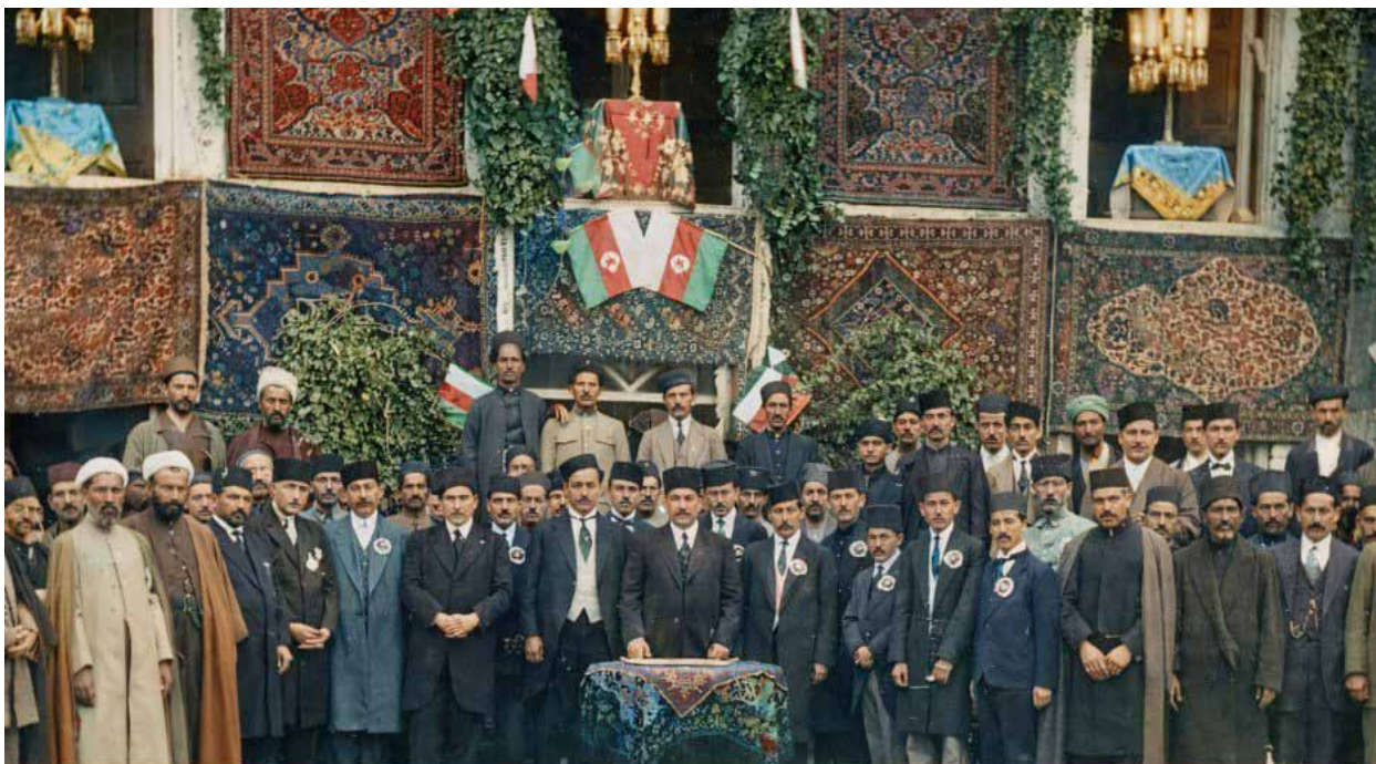
Открытие посольства АДР в Тегеране. 21 марта 1920 года

Однако позиция иранского государства по отношению к Азербайджану уже тогда была неоднозначной. Еще с начала 1917 года выдвинутый азербайджанскими национальными партиями и передовой интеллигенцией на российском Кавказе лозунг о создании автономного Азербайджана встретил активное противодействие со стороны Тегерана. Вначале на страницах иранской прессы, а затем и устами официальных лиц, была устроена подлинная обструкция идее присоединения новому тюркскому государству на