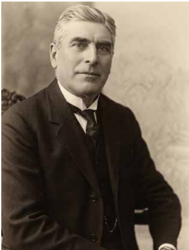
Алигулхан Масуд Энсери, министр иностранных дел Ирана, глава иранской делегации на Парижской мирной конференции

дипломат, он с первых дней играл важную роль в формировании внешней политики молодой республики. Вскоре после этого исторического события произошло еще одно событие чрезвычайной важности с точки зрения налаживания добрососедских отношений между двумя соседними странами. 16 августа из Энзели в Баку парохом прибыл 21-летний иранский шах Ахмед, который отсюда начинал путешествие в Европу. В Баку высокого гостя встречал новоиспеченный посол А.Зиядхан, который сопровождал его до Батума в специальном поезде, предоставленном азербайджанским правительством. В пути шах «от имени дружественного и братского народа Ирана» выразил благодарность за теплый и радушный прием, оказанный ему в Азербайджане. Кроме того, на церемонии прощания в Батуме перед посадкой на английский пароход иранский шах еще раз подчеркнул гостеприимство, оказанное ему в Азербайджане, и попросил А.Зиядхана передать его благодарность премьер-министру, азербайджанскому правительству и народу. Наряду с этим, в пути от Баку до Батума А.Зиядхан и министр иностранных дел Ирана Фируз