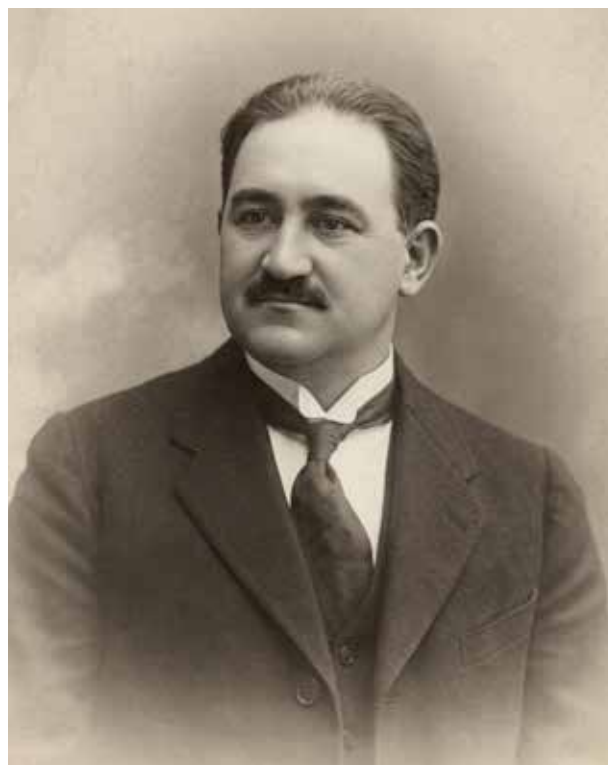
Мамед Эмин Расулзаде - председатель Национального совета Азербайджана, глава первой азербайджанской делегации, направленной в Стамбул