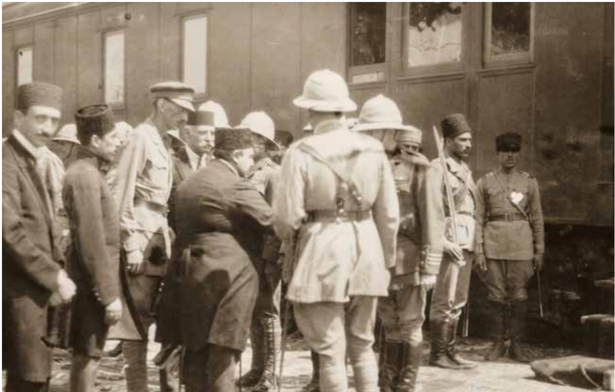
Проводы Ахмед шаха Каджара на Бакинском вокзале перед поездкой в Батуми в 1919 году. Во время поездки из Баку в Батуми его сопровождал Адиль хан Зиядхан.