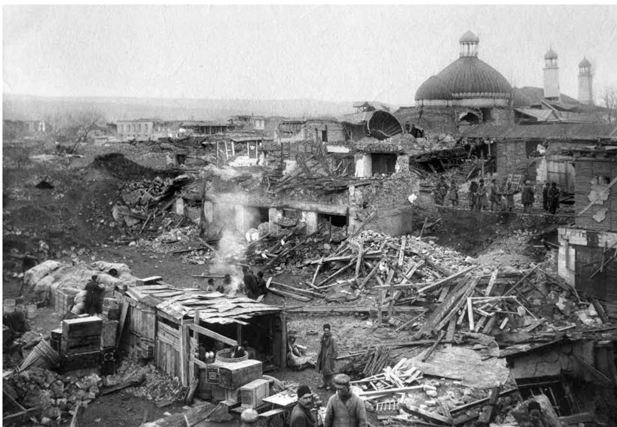
11606. Шемаха. Джума и Шихменазъ мечети и развалины домовъ. 16.