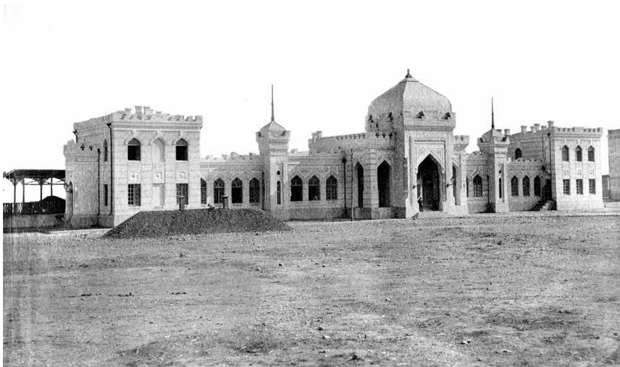
5158. Закавказская. Железная дорога. Станция Елизаветполь со двора.