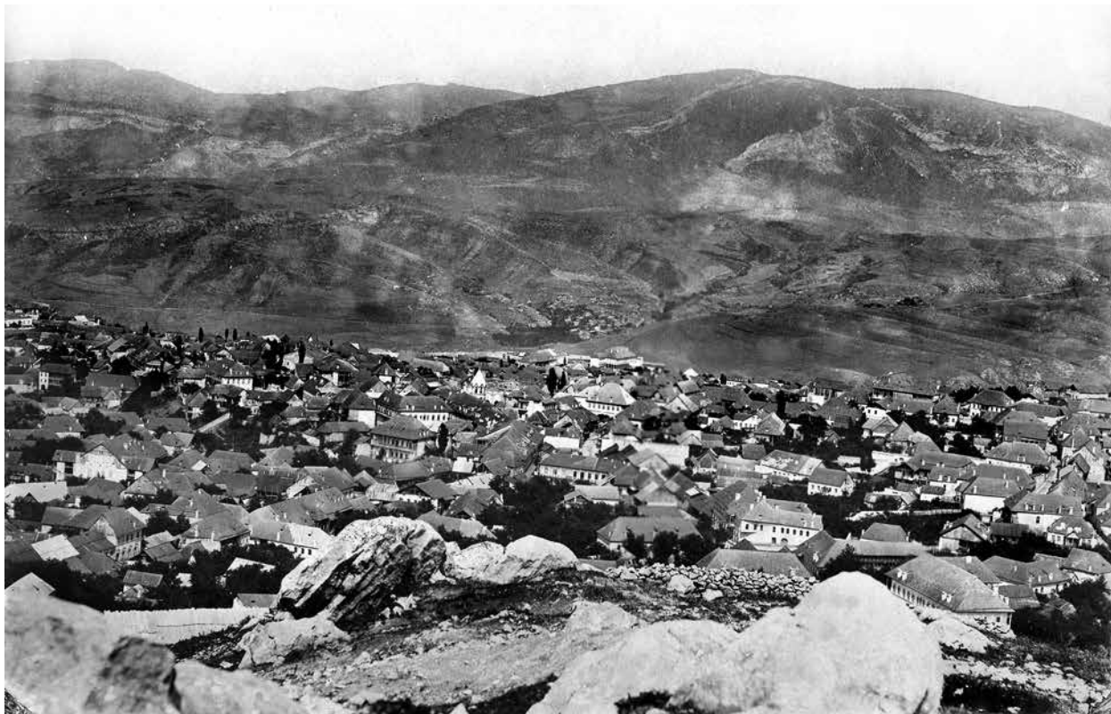
13452. Шуца городъ. 99.