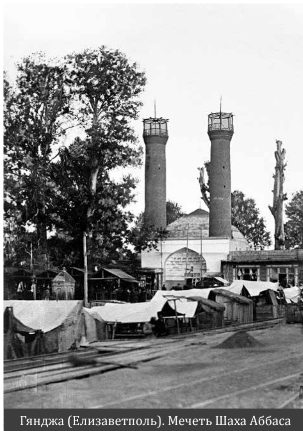
Гянджа (Елизаветполь). Мечеть Шаха Аббаса