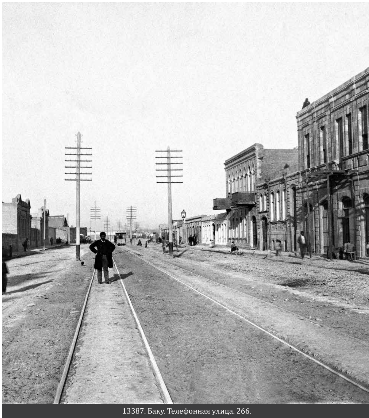
13387. Баку. Телефонная улица. 266.

«Шедевры истории» в Центре Гейдара Алиева в 2019 году.