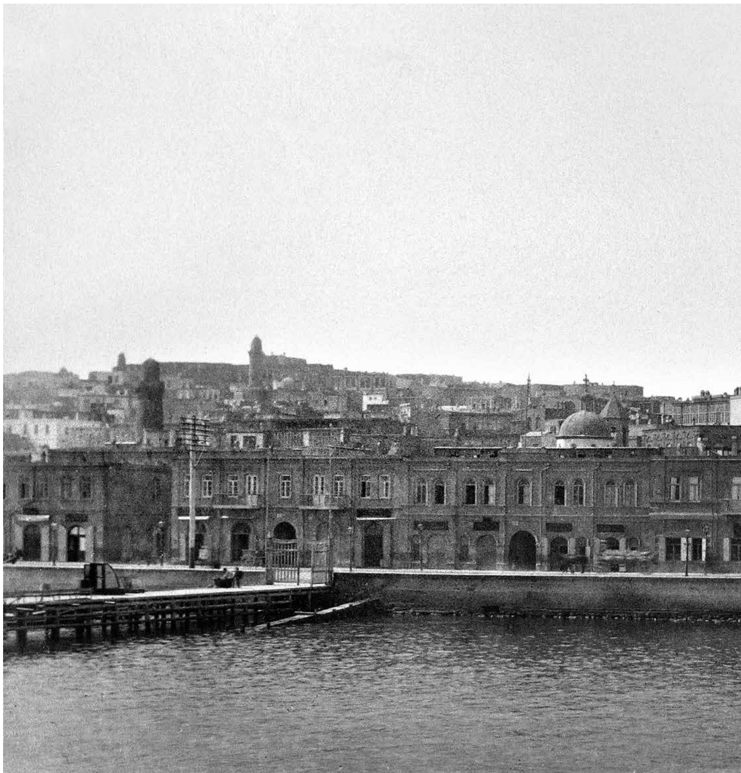
9858. Баку. Набережная. 83.

Историками неоднократно подчеркивалось огромное значение фотографий Д.Ермакова для изучения истории, экономической и общественной жизни Азербайджана середины XIX - начала XX века. Хотя фотографии, сделанные и собранные Ермаковым, находятся в различных коллек-