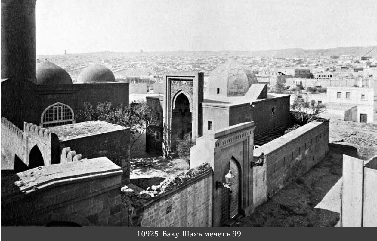
10925. Баку. Шахъ мечеть 99

архитектуру. На фотографиях можно увидеть архитектуру городов Баку, Агдаш, Гянджа, Лянкяран, Шамаха, Шуша, Шеки. Помимо панорамных снимков, привлекают внимание фотографии отдельных улиц, площадей, крупных общественных зданий, а также железнодорожных станций, промышленных предприятий. Есть работы, отражающие архитектурные особенности интерьеров домов, общественных и государственных учреждений того времени. Среди фотографий Дмитрия Ермакова целая серия изображает памятники, которые не дошли до наших дней. Например, есть снимки религиозных сооружений, уничтоженных в 20-30-е годы XX века в рамках борьбы советского режима против религии и ее пережитков. Многие из таких сооружений, включая мечети, мавзолеи, тюрбе, церкви, часовни, были целенаправленно уничтожены. Эти строения, их архитектурные достоинства мы можем сегодня видеть на фотоснимках Д.Ермакова. Нельзя не отметить хорошую серию видов «Ичери-шехер», на которых можно увидеть, каким был дворец Ширваншахов при российских царях. Несмотря на запущенное состояние этого замечательного памятника в тот период, мастер сумел разглядеть его красоту и оставил бесценные снимки, которые позже серьезно помогли в реставрационных