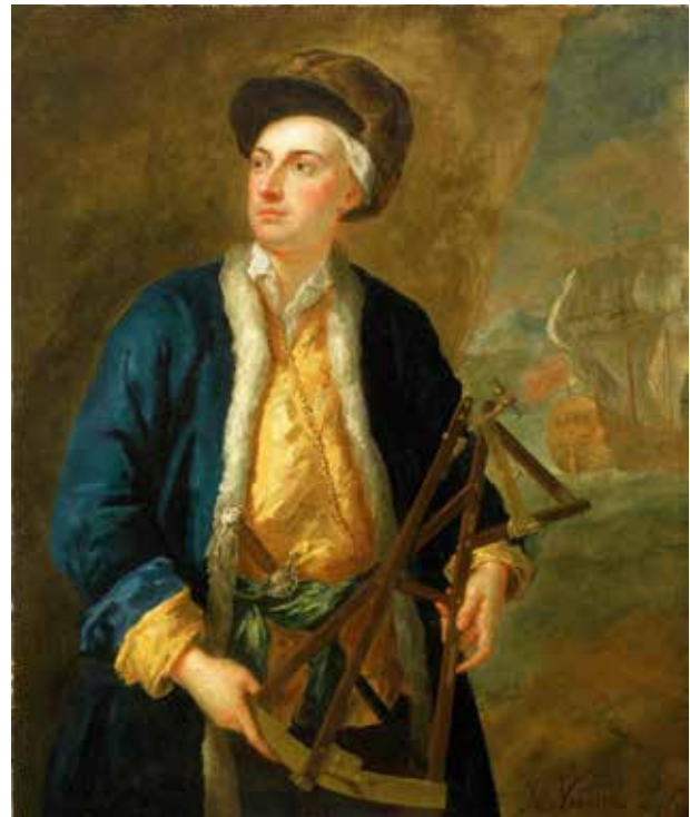
«Капитан Джон Элтон». Художник Джон Вандербанк (1694 -1739). В руках капитана изобретенный им «секстант Элтона»

ликих завоевателей Востока и придали его фигуре обще-евразийское измерение. Поход в Индию вывел Надир шаха, выходца из тюркско-азербайджанской военно-политической среды, за рамки региональной политики и закрепил за ним статус исторической личности глобального масштаба.