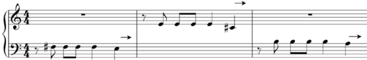
Koroghlu. Coro di Chanlibel

Non fu solo un trionfo artistico, ma anche una svolta culturale. Con essa, l'Azerbaijan fece conoscere la propria voce nella musica classica.