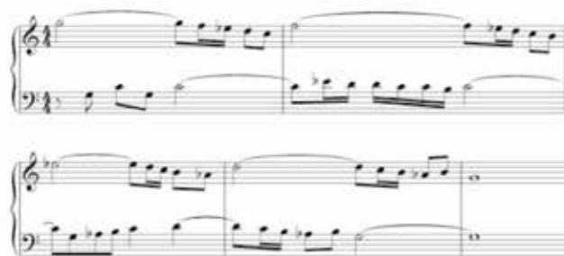
Arshin mal alan (Il venditore di stoffe). Il pianto di Gulchohra

Gli anni successivi portarono un'esplosione di creatività. Hajibeyli si rivolse a leggende ed epiche – Sheikh Sanan, Rustam e Zohrab, Asli e Karam – intrecciandole in arazzi operistici. Eppure era altrettanto a suo agio con l'umorismo. Le sue commedie musicali, come "Marito e moglie" e "Se non quello, allora questo", satirizzavano le abitudini sociali con arguzia e fascino. Poi, nel 1913, arrivò "Il venditore di stoffe", una storia d'amore avvolta in melodie leggere e intrighi giocosi. Più di un secolo dopo,