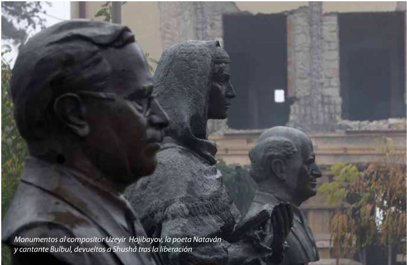
Monumentos al compositor Uzeyir Hajibayov, la poeta Nataván y cantante Bulbul, devueltos a Shushá tras la liberación

El viaje en autobús, con paradas para refrescarse, duró siete horas. Al adentrarnos en territorio previamente ocupado en la región de Fuzulí, se nos abrió un panorama completamente nuevo durante los últimos 60 minutos. Incluso la recién construida Zefer Yolu (Camino de la Victoria) era impresionante, una maravilla en sí misma, construida en tan poco tiempo y serpenteando a través del verde paisaje de las montañas del Cáucaso Menor; menor en altura, quizás, pero de ninguna manera en efecto. Era una exhibición particularmente hermo-