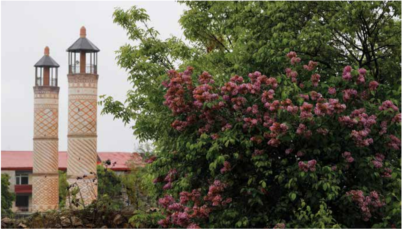
Minaretas de la Mezquita Yukharí Govhar-agá

Al día siguiente subimos a la cima de esa pared rocosa, a Jidír Duzú, donde disfrutamos de vistas de un mundo de maravillas naturales. Empezando por el aire: respirarlo era comprender por qué tantos cantantes y músicos de Azerbaiyán comenzaron sus vidas allí. Se experimentan