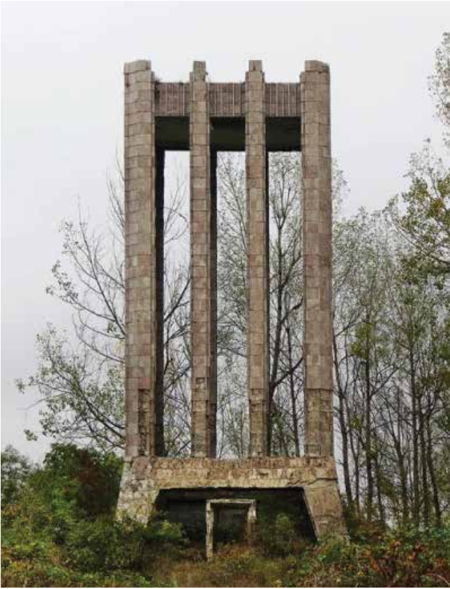
Mausoleo del siglo XVIII del poeta M.P. Vagif durante la ocupación (a la izquierda) y después de la restauración, 2022