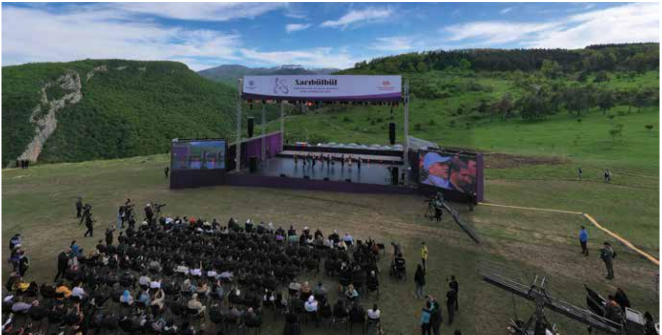
Festival Internacional de Música Jarí Bulbul que se vuelve a celebrar tras la liberación

De regreso, nos detuvimos en la tumba de Mir Mobsún Navváb (1833-1918) para rendir homenaje a otro contribuyente a la versatilidad cultural de la ciu-