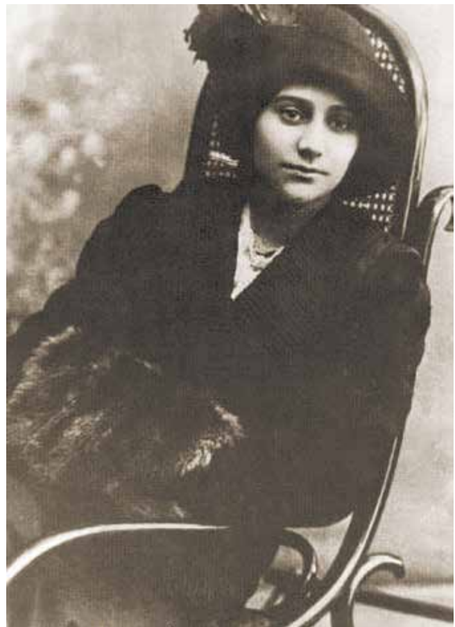
Shovkat Mammádova (1897-1981), primera cantante de ópera azerbaiyana

en este contexto, añadiendo a esta victoria la educación gratuita y la libertad de prensa. Fue toda la clase política la que desempeñó un papel principal en el proyecto modernista de la República de Azerbaiyán a favor de la emancipación de la mujer.