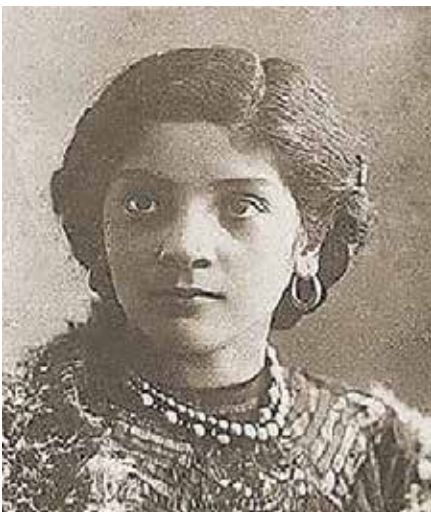
Fatma Mukhtarova (1893-1972), cantante de ópera azerbaiyana