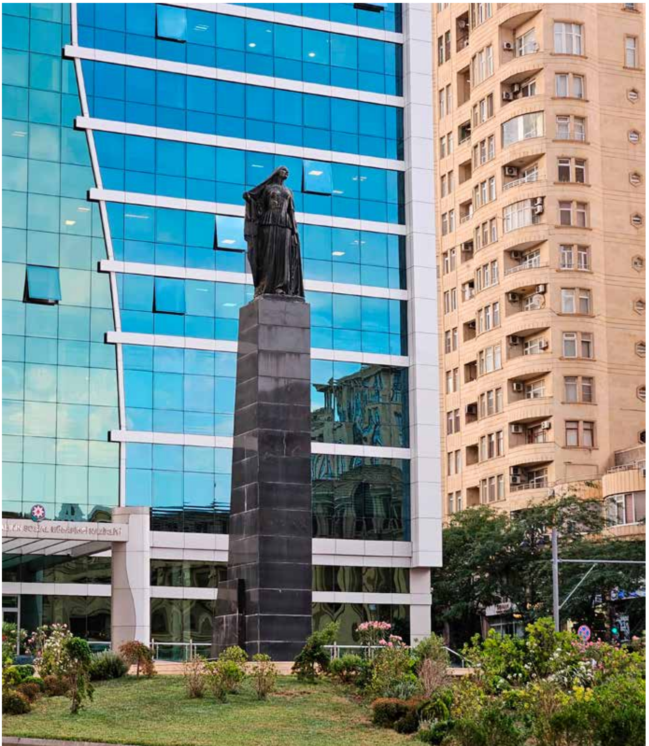
Estatua "Mujer azerbaiyana liberada", ciudad de Bakú. Escultor: Fuad Abdurahmanov

más mujeres en la vida política. Sin duda alguna, este hecho es resultado de la escolarización de las adolescentes (el 94,54% están matriculadas, según las estadísticas de la UNESCO) y, aunque el proyecto de la Universidad