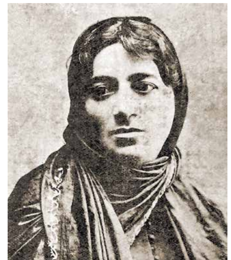
Shafiga Efendizade, primera publicista y periodista azerbaiyana