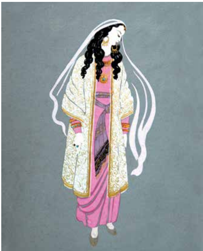
Skizze des Kostüms zur Oper von Useir Hadschibayow „Leyli und Madschnun“. Holst, Aquarelle, Gouache. 1957.