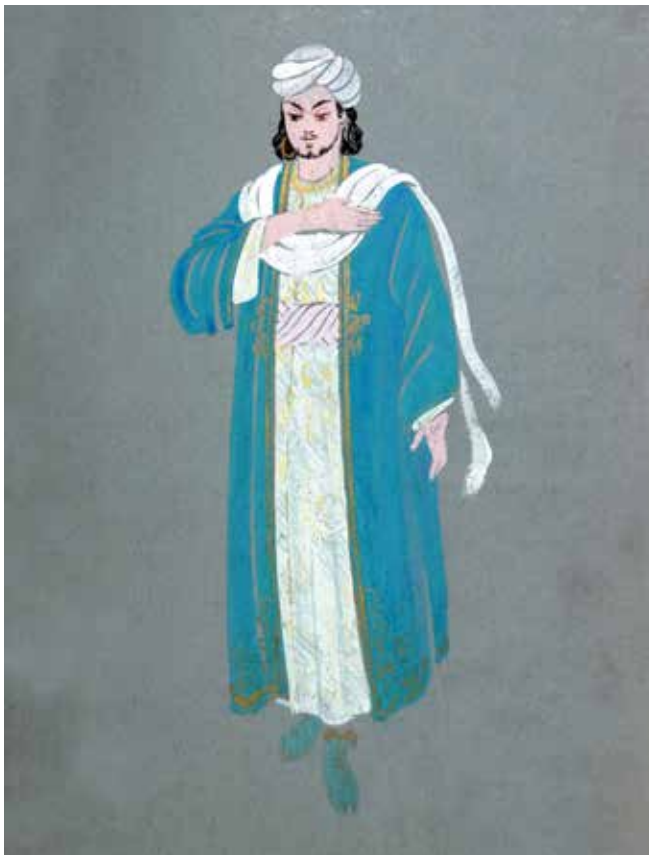
Ibn Salam. Skizze des Kostüms zur Oper von Useir Hadschibayow „Leyli und Madschnun“. Holst, Aquarelle, Gouache. 1957.

Talent erweckte die Aufmerksamkeit des Chefkünstlers des Aserbajdschanischen Staatlichen Dramatheaters, Rustam Mustafayew, und er lud Badura ein, am Haupttheater der Republik zu arbeiten. Ihr Debüt am neuen Arbeitsplatz fand in der Theatersaison 1938-1939 statt, wobei sie als Assistentin des Künstlers I. Akhundow für das Stück Stiefmutter nach dem Werk von Honore de Balzac tätig war. Während der Arbeit am Theaterstück Sevil von Dschabbarli adaptierte sie, zusammen mit dem Bühnenbildner A. Abbasow, mehrere Kostüme dafür. In diesen Arbeiten zeigte Badura Afganly wertvolle Qualitäten und hohe Anforderungen an sich selbst.