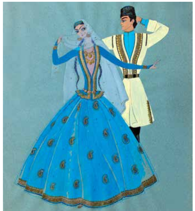
Skizzen der Kostüme für das Aserbaidsschanische Staatliche Ensemble des Gesangs und Tanzes. Holst, Aquarelle, Gouache. 1970er Jahre.