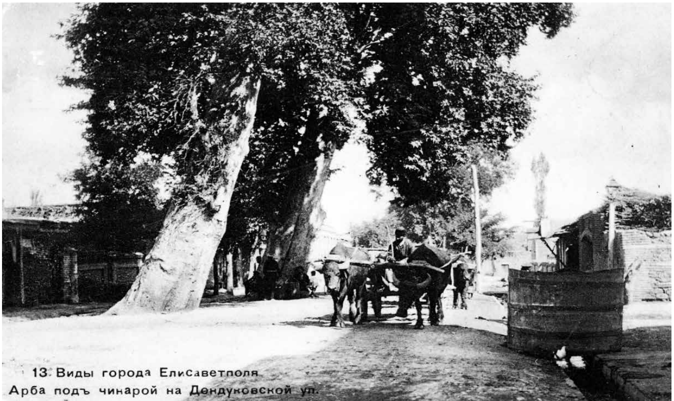
13. Виды города Елисаветполя Арба подъ чинарой на Дендунговской ул.

των Ουντίων. Από το 654 αυτή άρχισε να πληρώνει φόρο υποτέλειας στους Άραβες και πολιτικά υποτάχτηκε σε αυτούς. Παράλληλα αυτή εναλλάξ πλήρωνε φόρο υποτέλειας και στους Χαζάρους και στο Βυζάντιο. Η ιστορία της περιοχής αυτής με το πιο στενό τρόπο συνδέεται με την ιστορία του αραβικού χαλιφάτου, αλλά και το Βυζάντιο. Από την περίοδο αυτή καθιερώνονται στενότερες πολιτιστικές και οικονομικές σχέσεις μεταξύ του Βυζαντίου και των λαών της αναφερόμενης περιοχής.