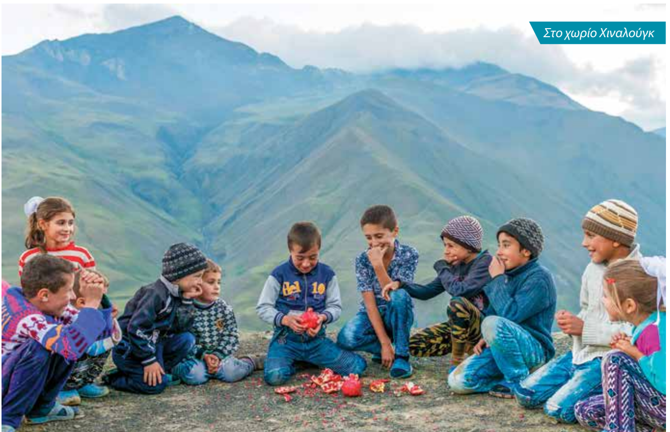
Στο χωρίο Χιναλούγκ