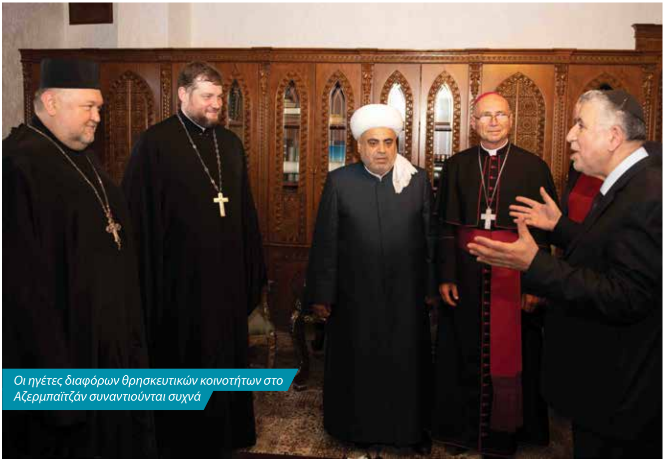
Οι ηγέτες διαφόρων θρησκευτικών κοινοτήτων στο Αζερμπαϊτζάν συναντιούνται συχνά