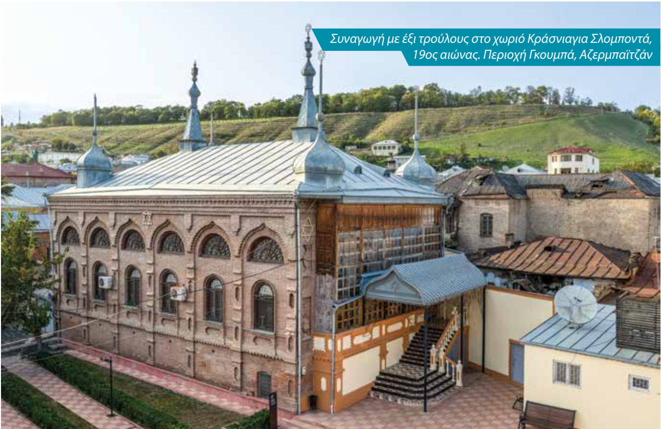
Συναγωγή με έξι τρούλους στο χωριό Κράσνιαγια Σλομποντά, 19ος αιώνας. Περιοχή Γκουμπά, Αζερμπαϊτζάν