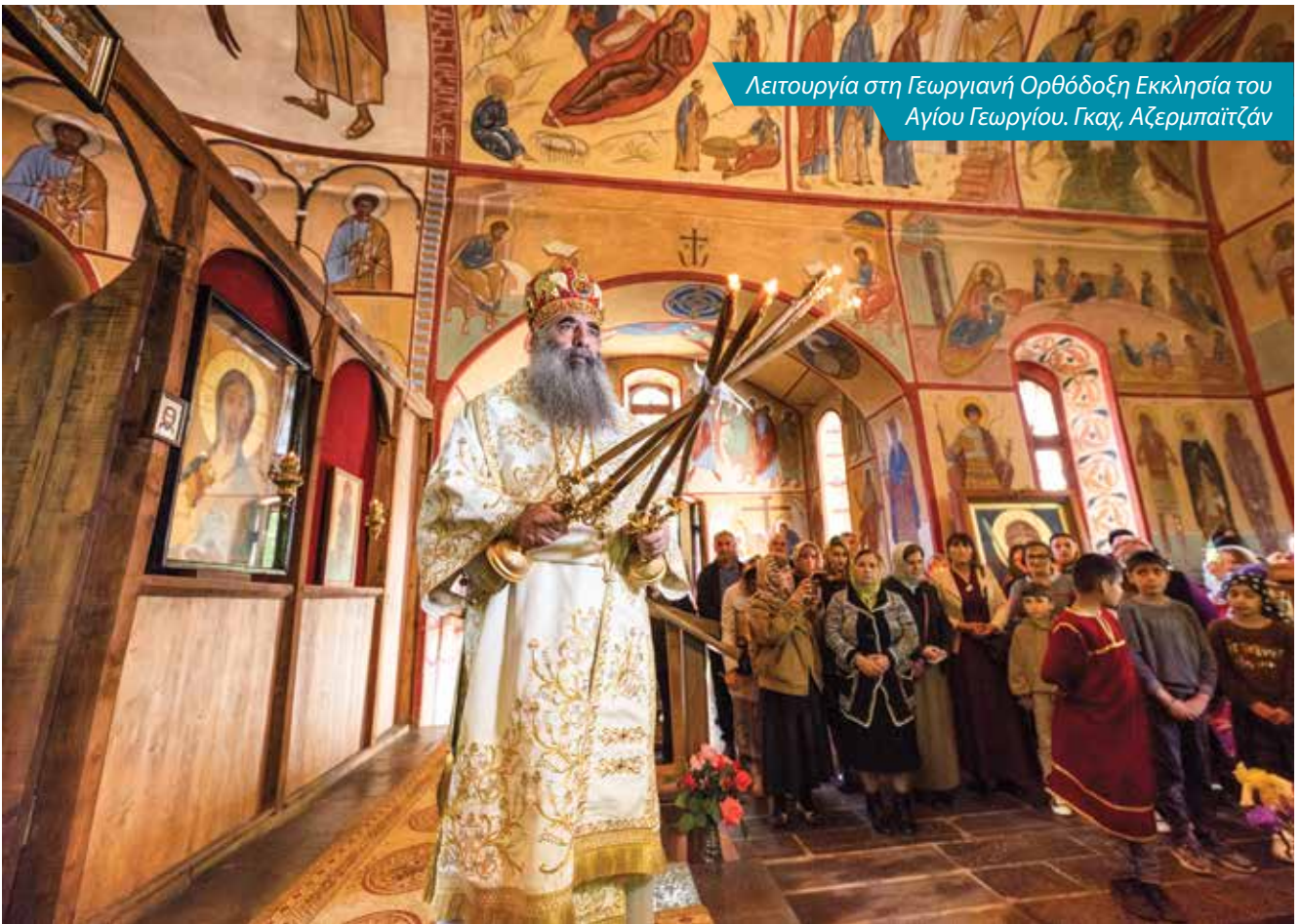
Λειτουργία στη Γεωργιανή Ορθόδοξη Εκκλησία του Αγίου Γεωργίου. Γκαχ, Αζερμπαϊτζάν

νότητα. Το ίδιο μπορεί να ειπωθεί για τους οπαδούς της Ορθοδοξίας, καθώς και για τον Προτεσταντισμό και τον Καθολικισμό – τις χριστιανικές θρησκείες που ήρθαν στα εδάφη του Αζερμπαϊτζάν τον 19ο αιώνα. Μια τρίτη μονοθεϊστική θρησκεία, ο Ιουδαϊσμός, ασκείται επίσης στο Αζερμπαϊτζάν από την αρχαιότητα. Οι ορεινοί Εβραίοι που ζουν σε αυτή τη γη για αιώνες, στους οποίους αργότερα προστέθηκαν και οι Γεωργιανοί Εβραίοι, και σχετικά πρόσφατα οι Ασκενάζι, εμπλουτίζουν σημαντικά την εθνική θρησκευτική παλέτα του Αζερμπαϊτζάν. Σήμερα, όταν τα κύματα αντισημιτισμού και ισλαμοφοβίας αυξάνονται σε διάφορα μέρη του πλανήτη, το Αζερμπαϊτζάν φαίνεται να αποτελεί ένα από τα μικρά «νησάκια» ειρήνης και ανεκτικότητας που δεν γνωρίζει κάτι κακό. Οι προσευχές που γίνονται στις συναγωγές για την ενότητα και την ευημερία του λαού του Αζερμπαϊτζάν αποτελούν ένα αρμονικό σύνολο με τους ήχους του αζάν των τζαμιών και των καμπανών των εκκλησιών, που συγχωρεύονται σε έναν ενιαίο ύμνο που δοξάζει την ενότητα και την αδελφοσύνη μεταξύ των ανθρώπων.