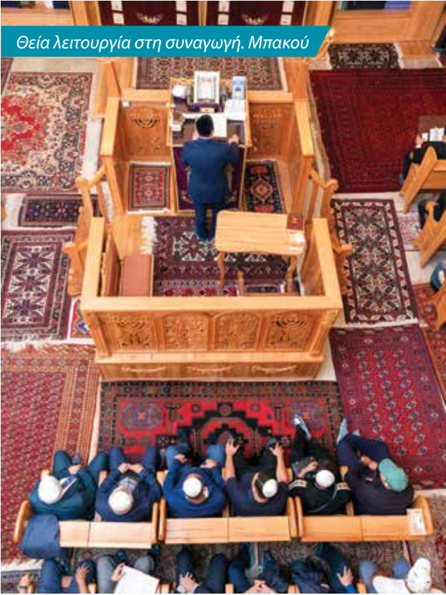
Θεία λειτουργία στη συναγωγή. Μπακού