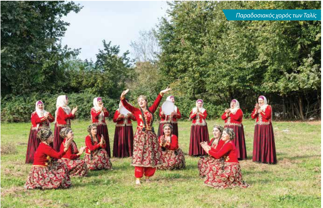
Παραδοσιακός χορός των Ταλίζ