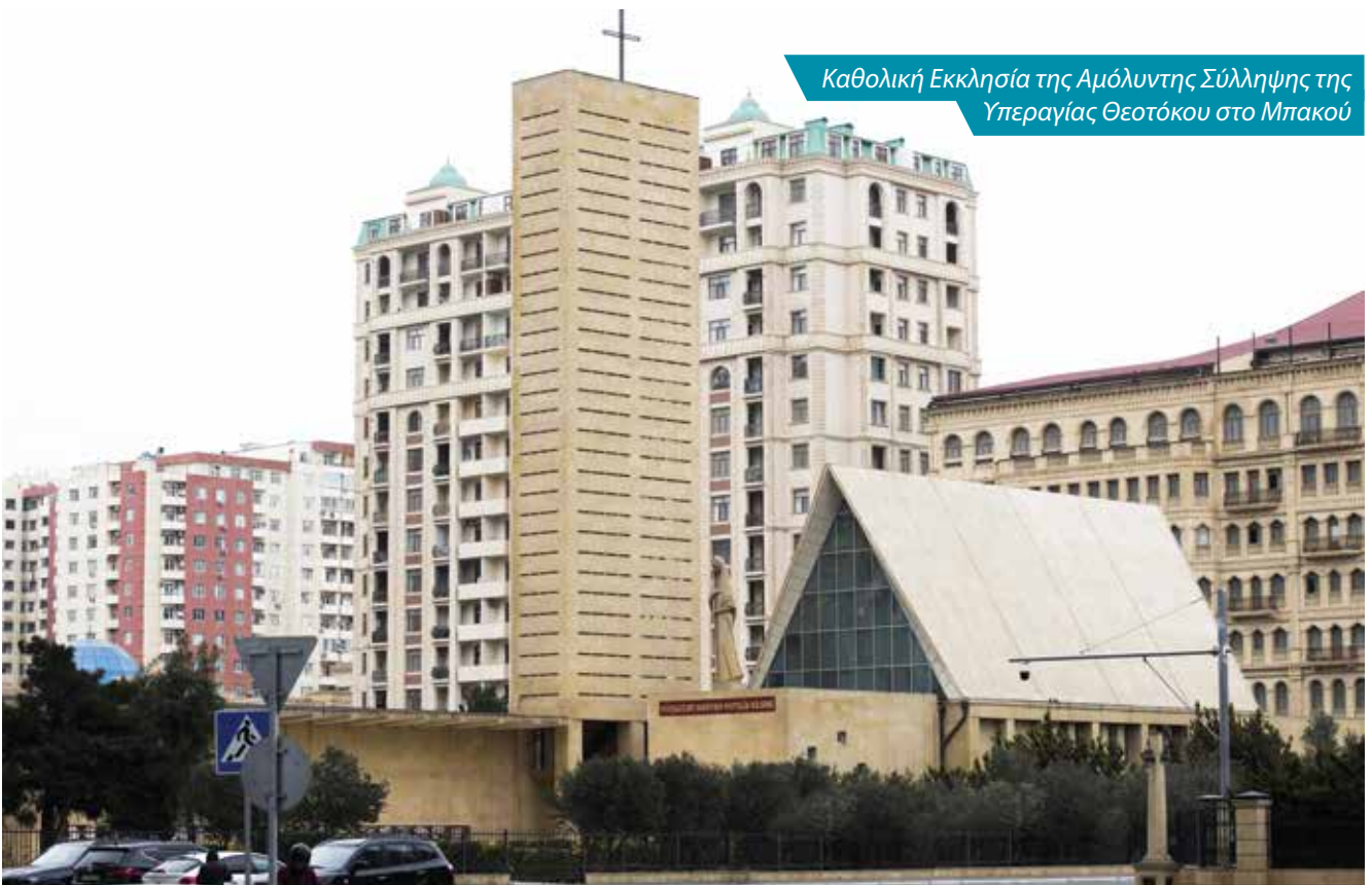
Καθολική Εκκλησία της Αμόλυντης Σύλληψης της Υπεραγίας Θεοτόκου στο Μπακού