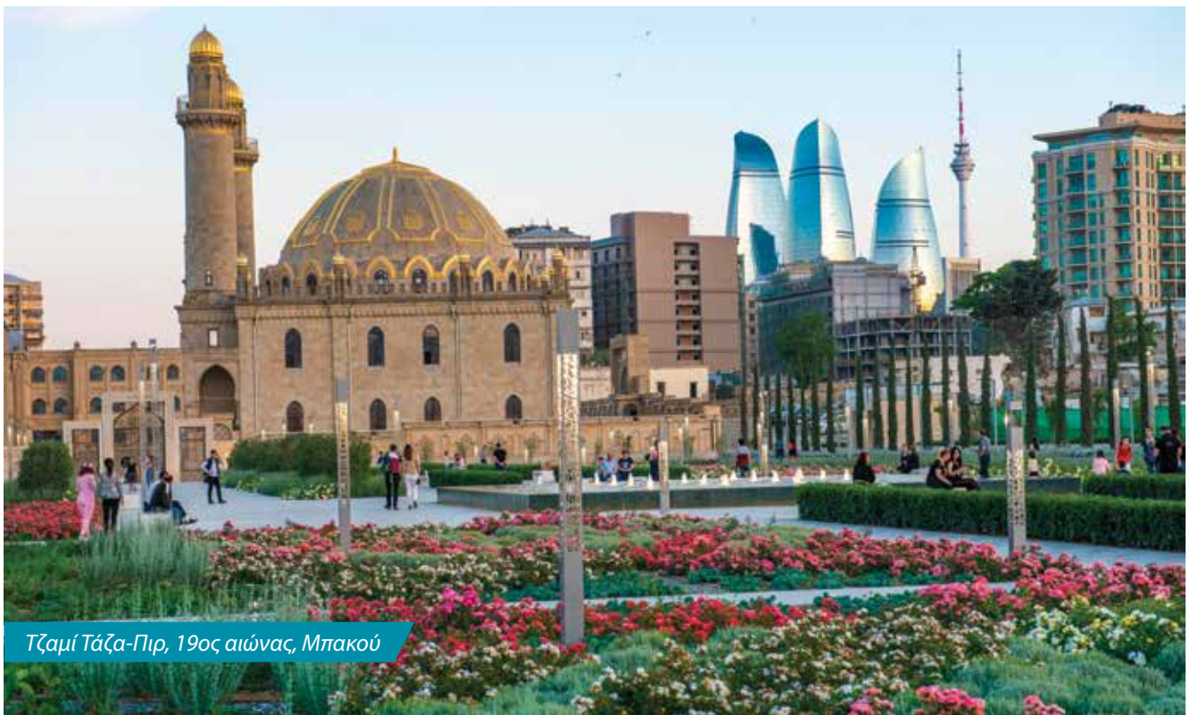
Τζαμί Τάζα-Πιρ, 19ος αιώνας, Μπακού