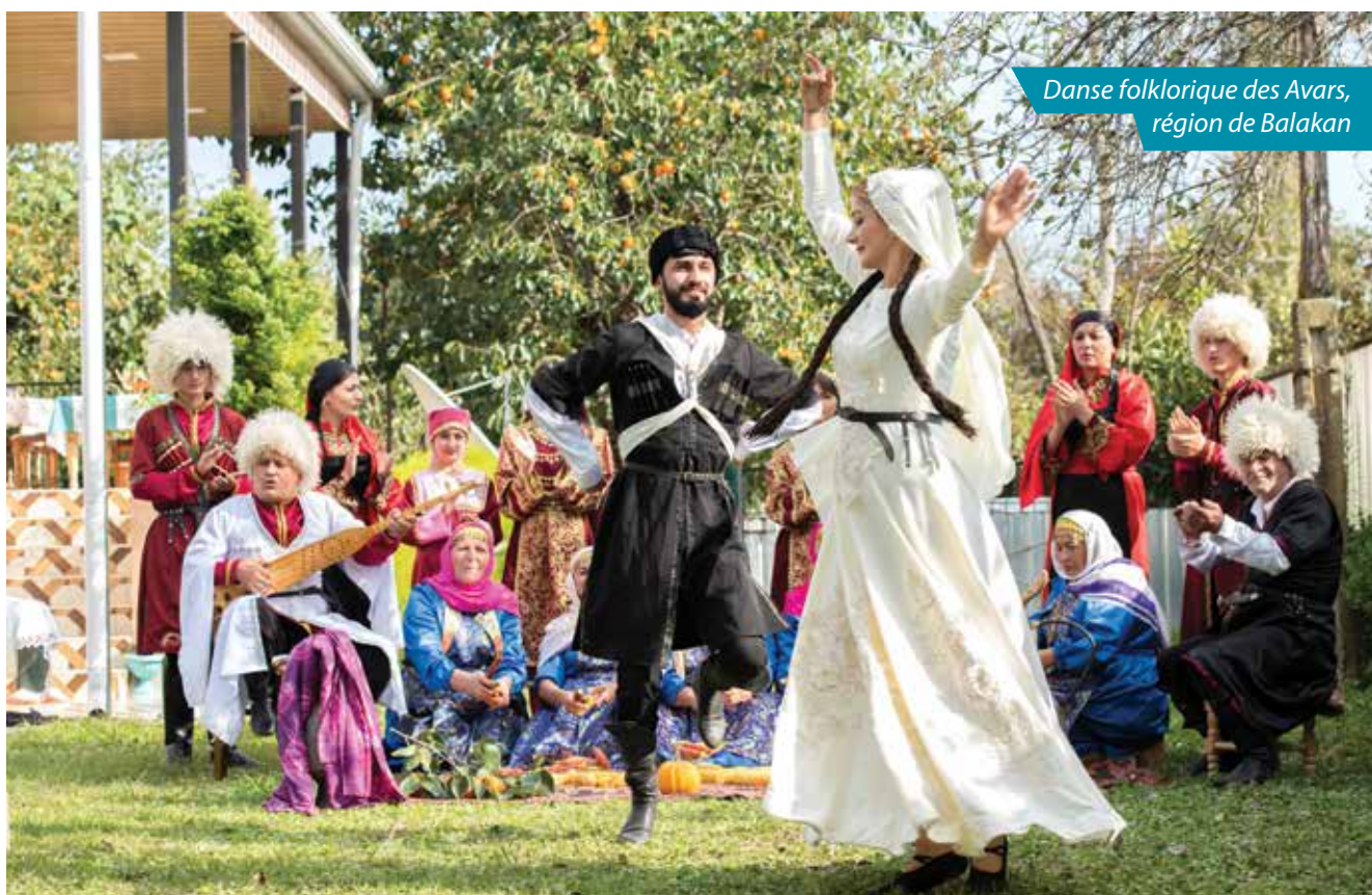
Danse folklorique des Avars, région de Balakan