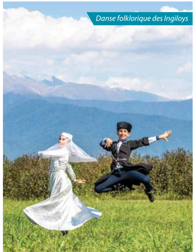
Danse folklorique des Ingiloyls