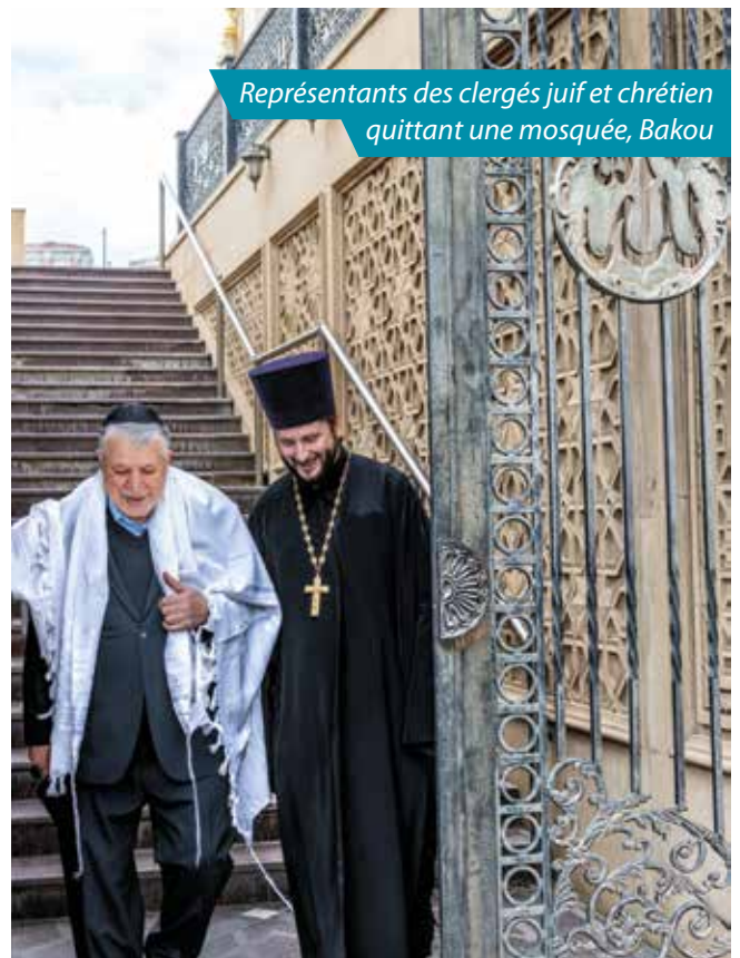
Représentants des clergés juif et chrétien quittant une mosquée, Bakou