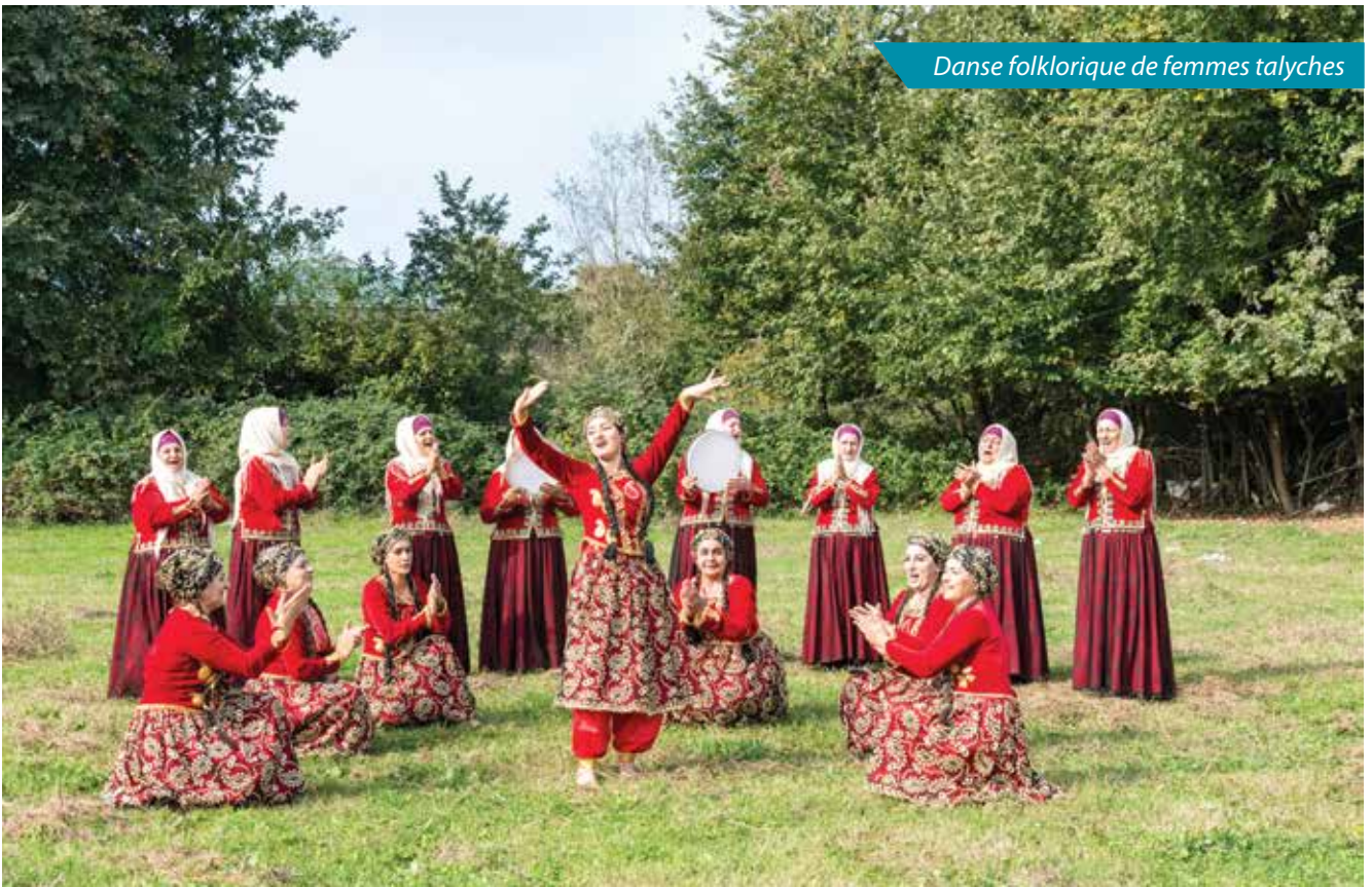
Danse folklorique de femmes talyches