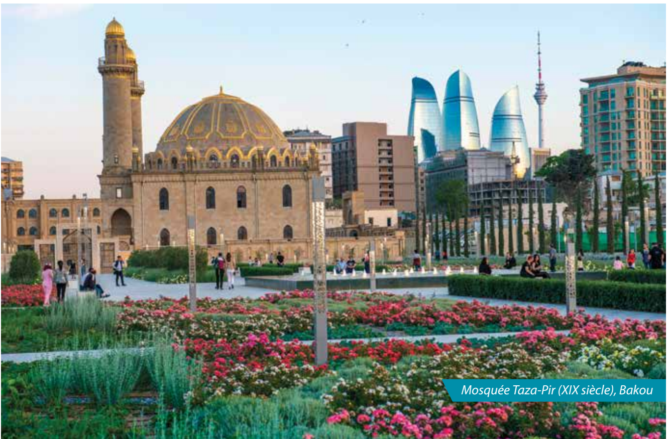
Mosquée Taza-Pir (XIX siècle), Bakou