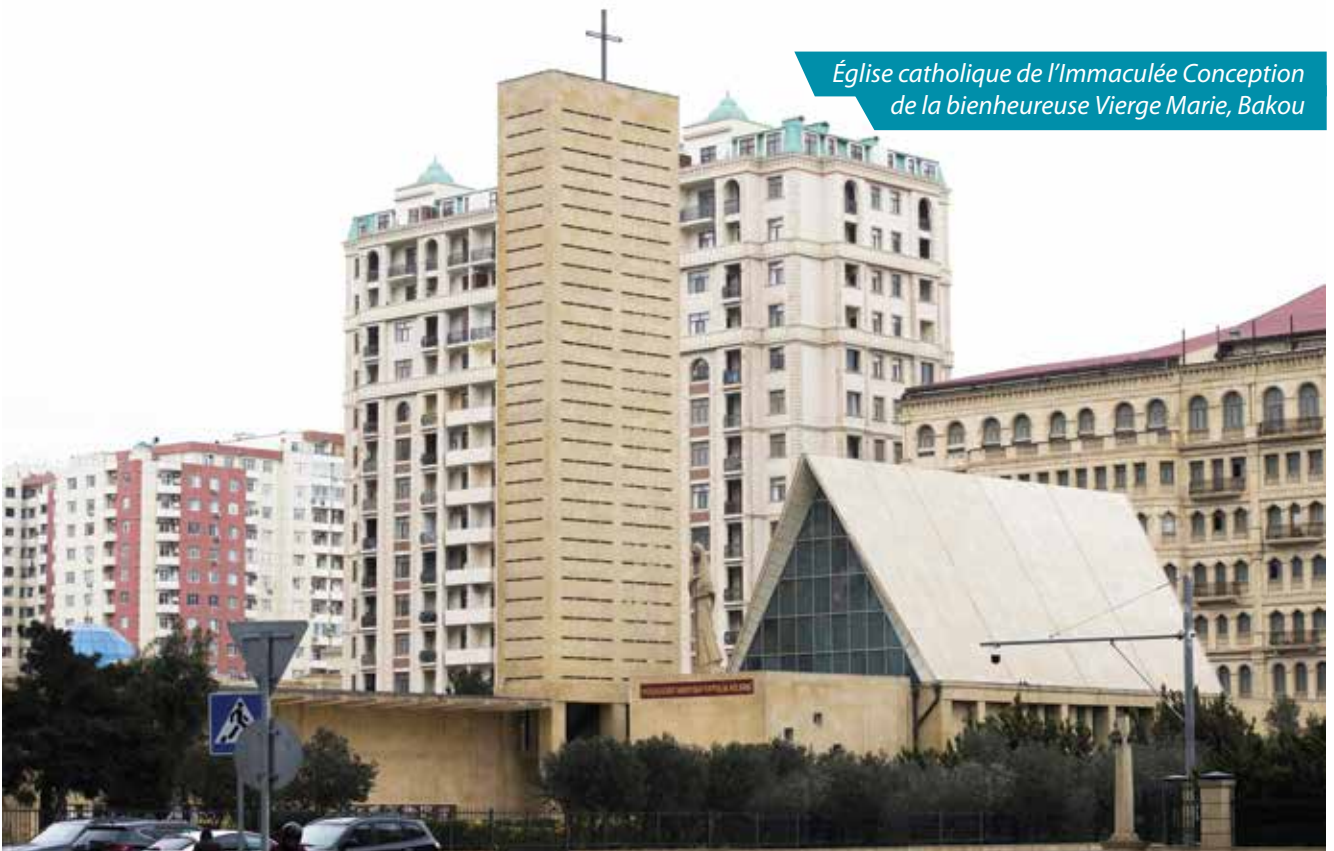
Église catholique de l'Immaculée Conception de la bienheureuse Vierge Marie, Bakou