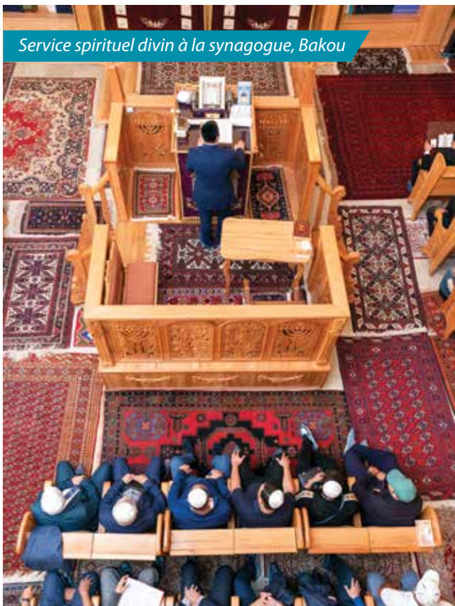
Service spirituel divin à la synagogue, Bakou