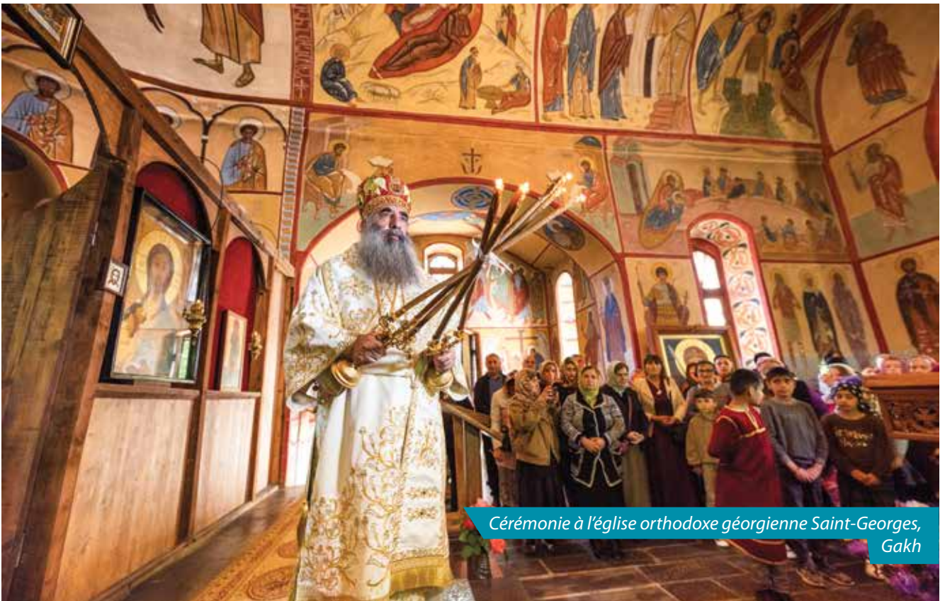
Cérémonie à l'église orthodoxe géorgienne Saint-Georges, Gakh