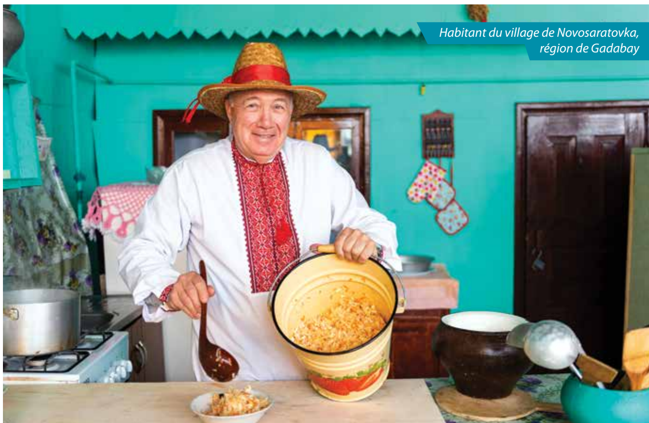
Habitant du village de Novosaratovka, région de Gadabay