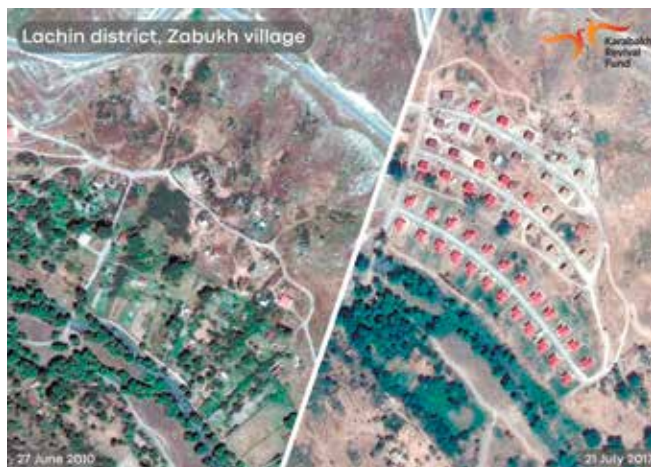
Okrug Lachin, selo Zabukh

Prijašnji armensko-azerbajdžanski sukob započeo je neutemeljenim teritorijalnim pretenzijama Armenije na azerbajdžanske zemlje. Usljed vojne agresije Armenije na Azerbajdžan između 1988. i 1994., Armenija je okupirala više od 20 % njegovih međunarodno priznatih teritorija. Četiri rezolucije Vijeća sigurnosti UN-a iz 1993. (822, 853, 874 i 884), kojima se zahtijevalo trenutačno povlačenje armenskih trupa s okupiranih azerbajdžanskih teritorija, nisu bile provedene sve do 44-dnevnog Domovinskog rata (27.10.2020. – 11.10.2020.), kada je Azerbajdžan, pod vodstvom vrhovnog zapovjednika oružanih snaga Republike Azerbajdžan, predsjednika