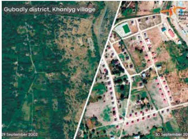
Okrug Gubadli, selo Khanlyg

teroristi i dalje koriste različite metode ekološkog terorizma te postoje presedani koji upućuju na kontinuirano ciljano napadanje okoliša s ciljem ostvarivanja političkih ciljeva. Nažalost, iako se ekoterorizam i dalje nalazi u središtu međunarodne pozornosti, dvosmislenost postojećih zakona i definicija stvari rupe u zakonu koje počinitelji koriste kako bi izbjegli odgovornost za svoje zločine.