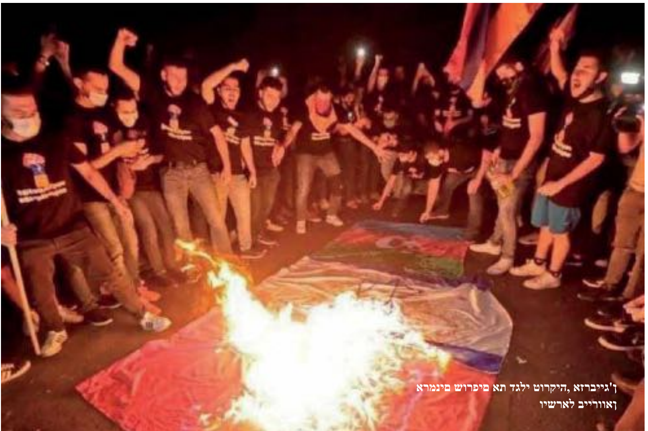
י' גייברזא, היקרוט ילגד תא מיפרוש מינמרא זאזוריב לארשיו