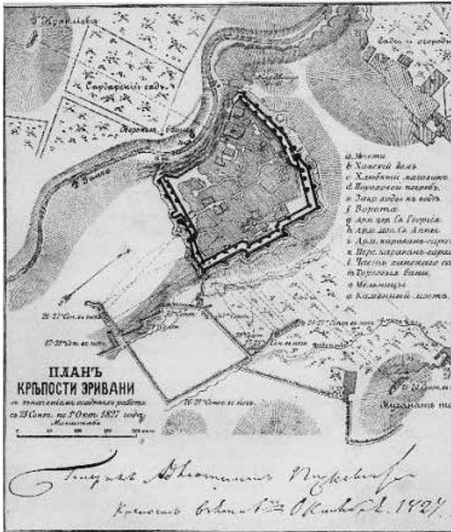
伊拉万要塞平面图。俄国军事指挥部在攻打要塞前夕绘制，1827年。