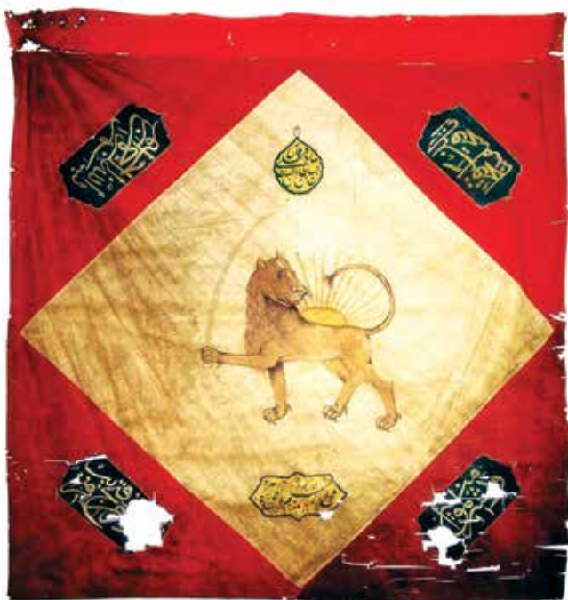
伊拉万汗国国旗，18世纪。 阿塞拜疆国家历史博物馆。

该地区发生了一场血腥战争。1905-1906年，亚美尼亚人利用俄国统治集团的亲亚美尼亚立场，在阿塞拜疆人聚居地区开始实行武力种族清洗政策，为在南高加索建立亚美尼亚国家奠定基础。1905-1906年间，亚美尼亚人在南高加索共15个地区展开了大规模屠杀，其中包括伊拉万、纳希切万、沙鲁尔-达拉拉亚兹、诺沃-巴亚济德、埃奇米亚津、亚历山德罗波尔、苏尔马利、舒沙、贾文希尔、杰布拉伊尔、赞格祖尔、甘贾、卡扎赫、阿拉什和博尔恰利，以及巴库、伊拉万、纳希切万、舒沙、甘贾、卡扎赫和第比利斯7个城市。在这一时期发生的大屠杀中，南高加索地区共有286个定居点被毁。[3]