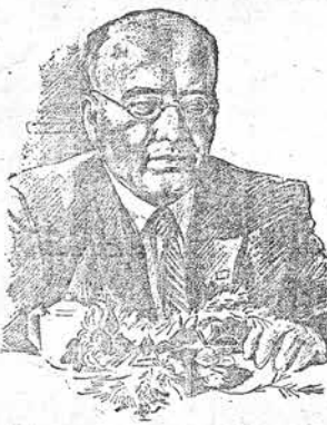
楚拉基在藝術工作者座談會上 (素描) 王文彬 作

納賽羅娃的演唱給我們的一點啓示。納賽羅娃的演唱給我們的一點啓示。納賽羅娃的演唱給我們的一點啓示。