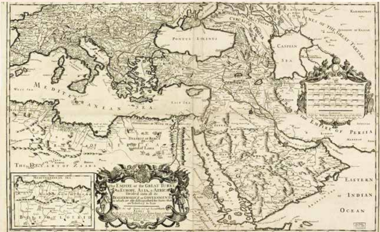
Карта английского картографа Уильяма Берри 1680 года. «Империя Великого Турка»

Арменией”, хотя правильнее называть эту территорию Западным Азербайджаном. Благоприятствующие исторические и геополитические факторы создали условия для миграции армян на Кавказ и образования армянского государства на чужих землях. Чтобы ответить на вопрос, почему арменисты пишут историю народа, а не историю страны Армения, необходимо рассмотреть ряд этапов многовековой мигра-