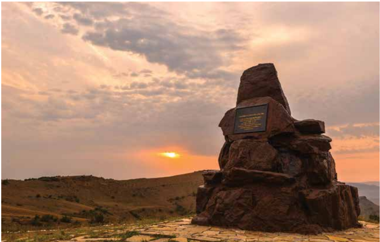
«Пик Ильхама Алиева» — одна из самых высоких стратегических высот региона

На протяжении позднего средневековья постройки и храмы комплекса Давида Гареджи не раз претерпевали различные набеги, причем особенно сильный ущерб нанесло монгольское нашествие XIII в. В иммунной грамоте среди прочих владений Мцхетского католикосата конца