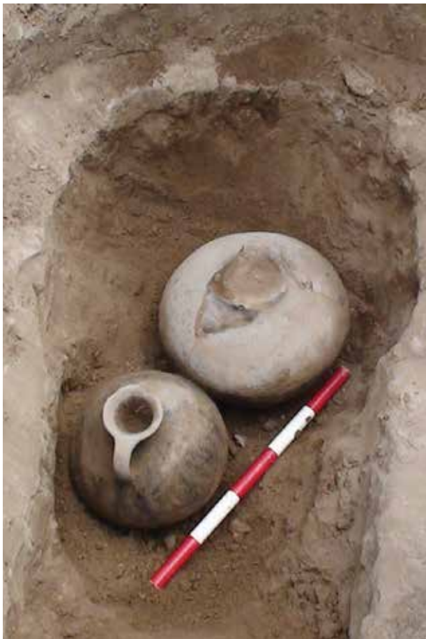
Археологические раскопки позднего бронзового-раннего железного века (Ходжалы-Гедабейская культура) в долине Кешикчидаг Курганлар (2011 г.)

не менее, в XV-XVI вв. здесь, видимо, произошло возрождение монастырско-религиозной жизни, ибо, согласно источникам, в начале XVII в. во время карательной экспедиции Сефевидского шаха Аббаса I против восставшего христианского населения региона погибло несколько тысяч монахов. В конце того же столетия сначала царь Теймураз, а затем царь Арчил предприняли меры к восстановлению монастырской жизни в Давид-Гареджийских кельях, и это удалось с утверждением настоятелем Онуфрия Гареджийского , который в награду за свою деятельность получил прежние монастырские земли. В XVIII в. из-за частых набегов северокавказских горцев монастырский комплекс вновь пришел в упадок, а в первой половине XIX в. практически и вовсе угас – только в монастыре Иоанна Крестителя осталось несколько старцев.