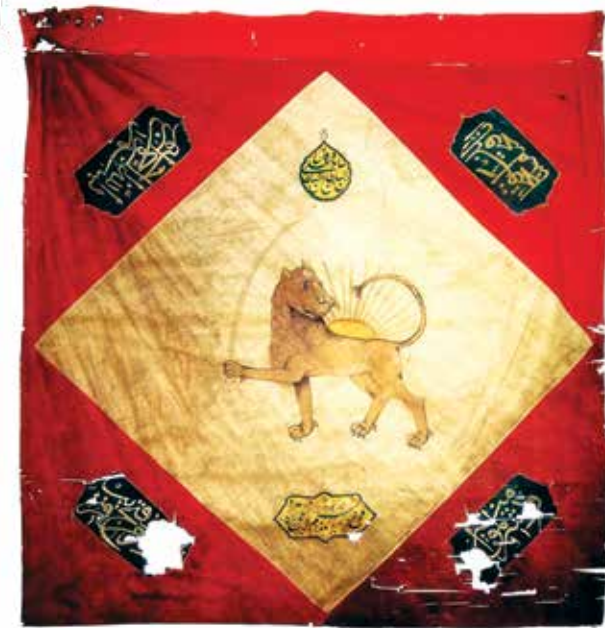
Флаг Иреванского ханства, XVIII в. Национальный музей истории Азербайджана

ласти» была переселена из Ирана и Турции 10.631 армянская семья, т.е. 57.266 человек. Всего же за 1828-1830-е годы на Южный Кавказ было переселено до 40 тыс. армян из Персии и до 84 тыс. – из Турции. Перед этим, в ходе войн России с Персией (1826-1828) и османской Турцией (1828-1829) в регионе было разрушено 359 мусульманских сел, жители которых погибли или спаслись бегством.