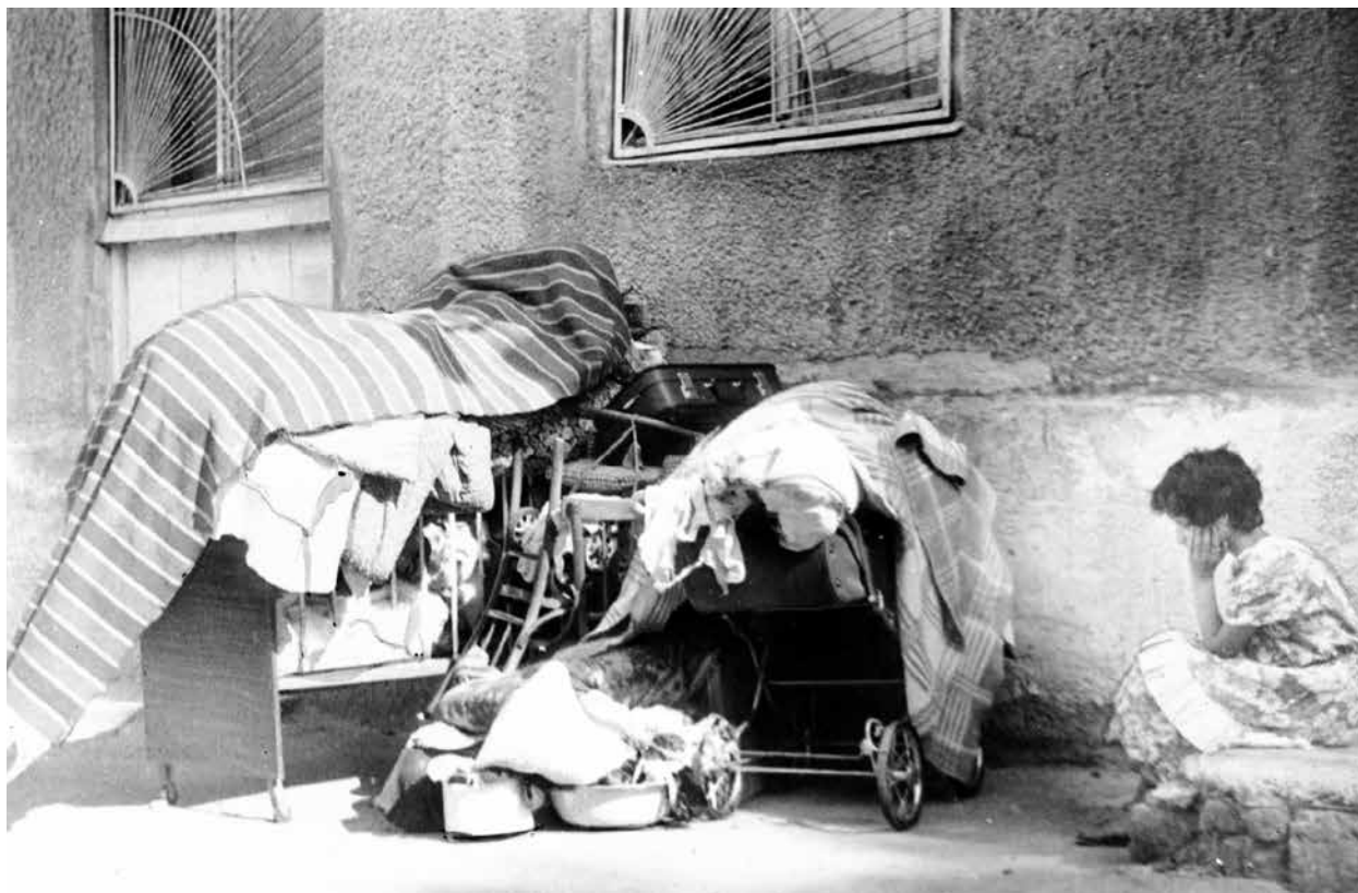
Безнадежность. Азербайджанская семья. Армения в конце 1980-х годов

Азербайджана занимала площадь 97.297,67 кв. км, а Араратской Республики (Армении), созданной в пределах бывшей Иреванской гу-