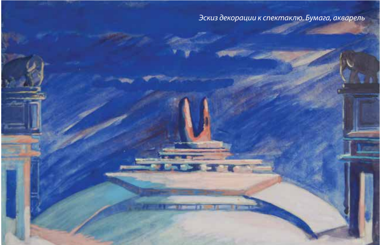
Эскиз декорации к спектаклю. Бумага, акварель