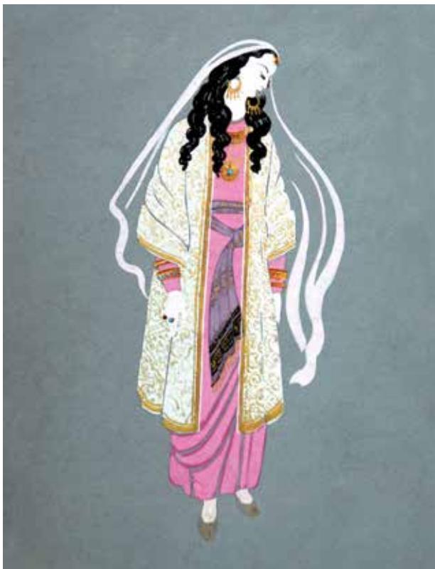
Эскиз костюма к опере Узеира Гаджибекова «Лейли и Меджнун». Бумага, гуашь, акварель. 1957

Ибн Салам. Эскиз костюма к опере Узеира Гаджибекова «Лейли и Меджнун». Бумага, гуашь, акварель. 1957