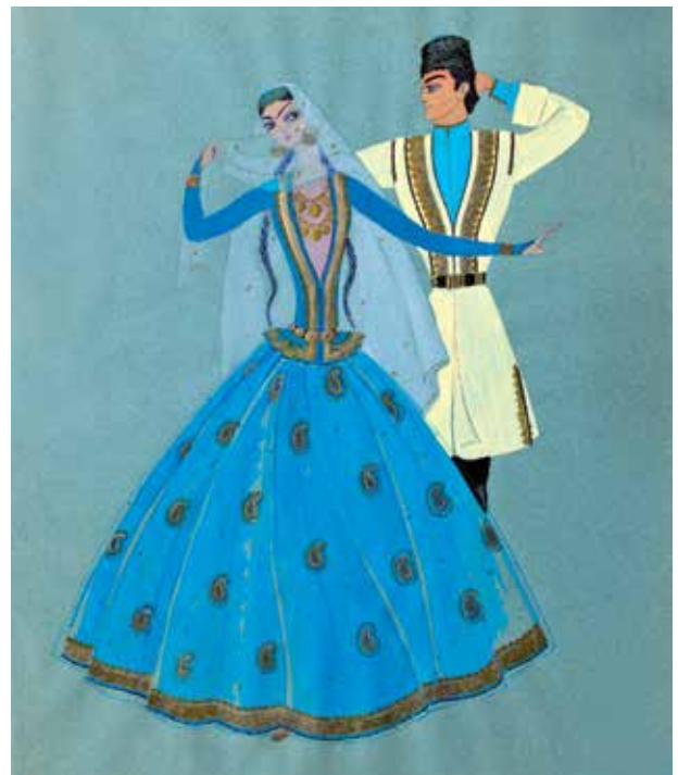
Карабах. Эскизы костюмов для Азербайджанского государственного ансамбля песни и танца. Бумага, акварель, гуашь. 1970-е гг.