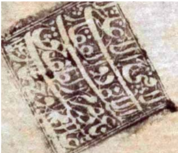
Образец печати Надир-шаха в 1734-1736 гг. до официальной коронации на Муганском курултае

исключением вплоть до XIX века. В некоторых случаях, при повторном утверждении прежних указов, и особенно при даровании муафства 5 или других привилегий применялась старая форма. Внутри страны указы Надир шаха адресовались представителям правящей элиты, знати или духовенства, за рубежом – правителям и главам местных администраций. Тексты прошений, фетв и шахских фирманов должны были отвечать некоторым обязательным нормам. Так, любое прошение на имя шаха составлялось от имени «ничтожнейшего из рабов», просящего о пожаловании «справедливого указа в виде милостыни благословенного, благороднейшего, священнейшего, возвышеннейшего высочайшего главы», и завершалось заверением в том, что «это деяние (т. е. «милость» правителя) перед Аллахом не будет на прасным». Все фирманы Надир шаха начинаются словами «Августейший указ был дан следующего содержания». Также следует отметить выражения «Принимая прибежище у Всевышнего», а также «Во имя Аллаха, лучшее из имен», «Вся власть принадлежит Аллаху», «Во имя Аллаха, Милостивого и Милосердного», «Он [Аллах]», «Во имя Аллаха», с которыми начинаются фирманы.