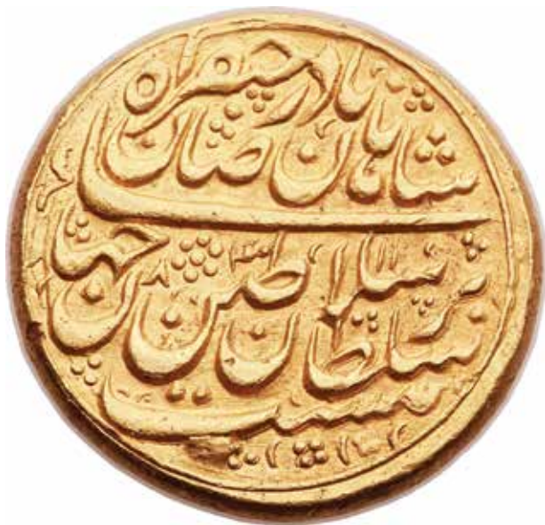
Золотая монета с именем Надир-шаха - ашрафи. Исфахан, 1747