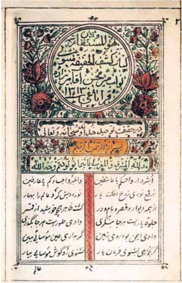
Страница книги М.М.Наваба «Трактат об открытии истины». Институт рукописей им. Физули Национальной академии наук Азербайджана

вал главную причину большинства общественных проблем и недостатков XIX века в слабости системы образования. В 1895 году он открыл в Шуше школу так называемого нового стиля обучения («усули-джадид») – стиля, который на то время был прогрессивным течением в народном просвещении. В школах нового стиля преподавание велось на родном языке, русский же язык преподавался в качестве самостоятельного предмета. Главное внимание уделялось преподаванию светских предметов на основе новейшей для того времени методики.