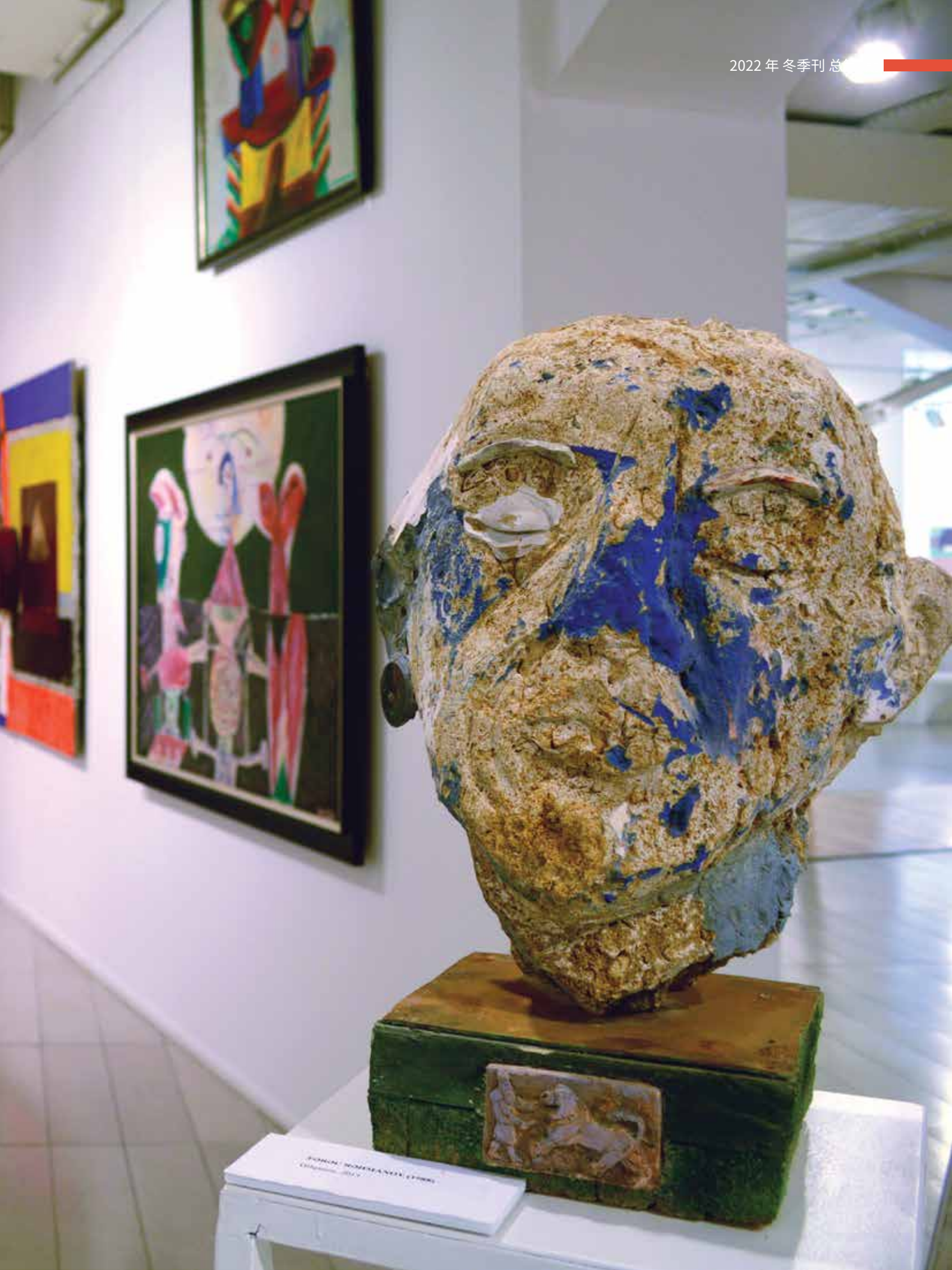
ПОРТРЕТ ЧУВСТВЕННИКА 1964 г.