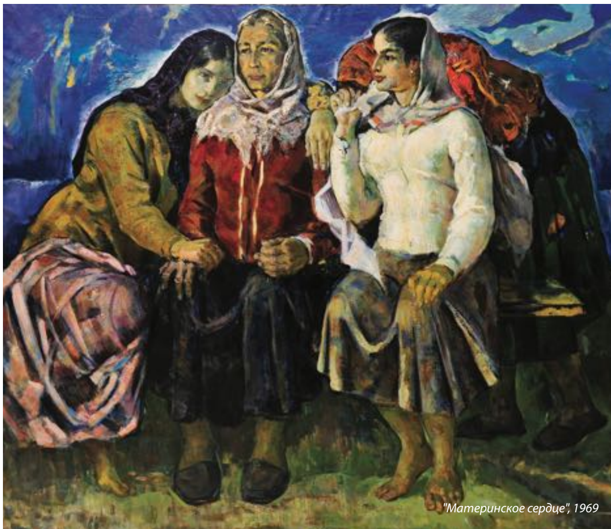
"Материнское сердце", 1969