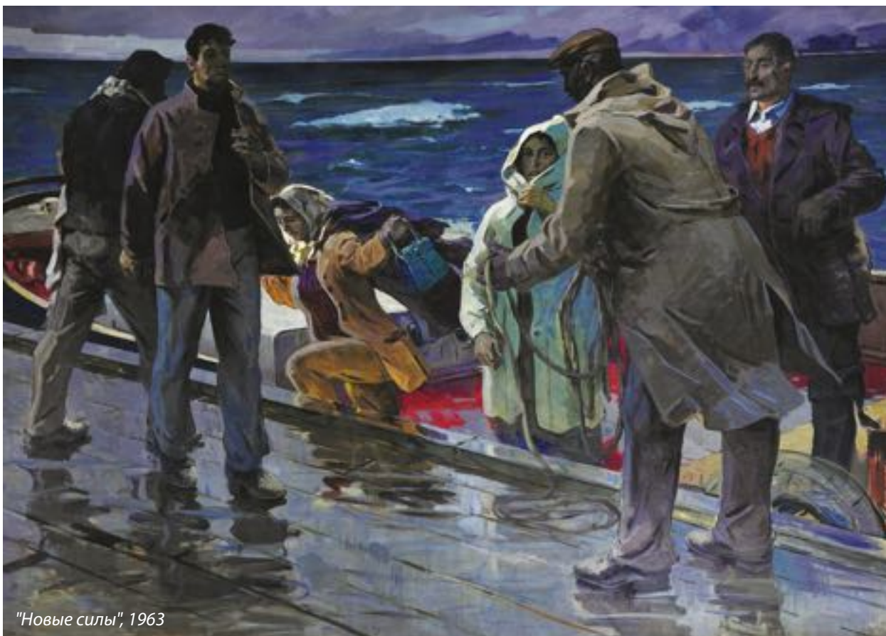
"Новые силы", 1963

дал также портрет красного комиссара Новруза Асланова.