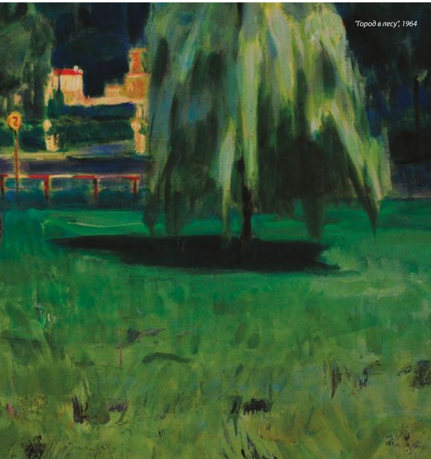
"Город в лесу", 1964

ность к яркой, красочной манере изображения, характерной для азербайджанской художественной школы.