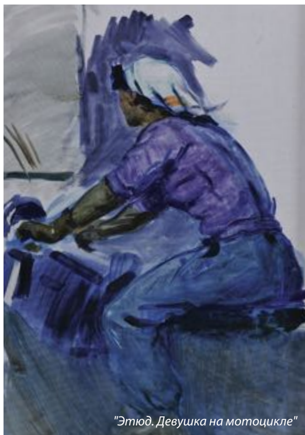
"Этюд. Девушка на мотоцикле"

В послевоенные годы Баба Алиев создал целый ряд многофигурных полотен, изображающих труд рабочих и крестьян, самоотверженную трудовую деятельность и отдых нефтяников. Именно эти темы, составляющие главное направление творчества художника, принесли ему широкую известность. Среди таких работ можно особо