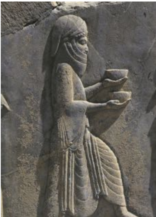
Маг на барельефе в Персеполисе. Эпоха Ахеменидов

«Шестнадцатый век был периодом, наслаждавшимся космической гармонией, и музыка была в сердце этой магии. Окультурная сила музыкальных ладов отражала и усиливала естественные гармонии планет; она была земной манифестацией звёзд и совершенством всей космической системы».