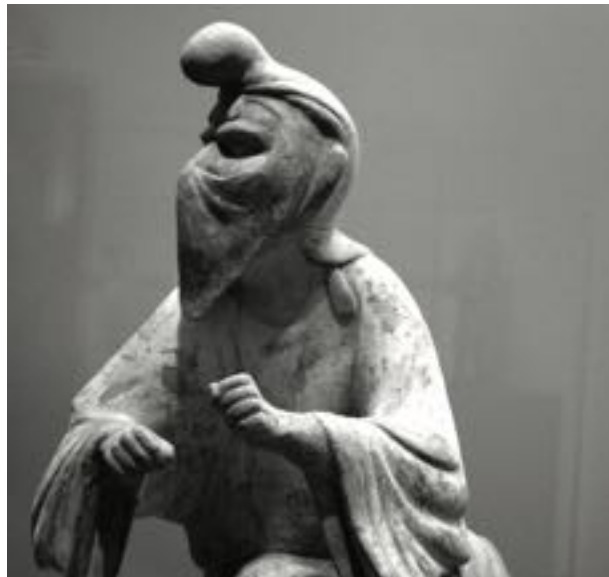
Керамическая статуэтка мага. VIII век. Согдиана. Музей восточного искусства, г. Турин (Италия)

Вот отсюда и начинается та самая Пифагорова музыка небесных сфер! Не только для азербайджанцев, но, пожалуй, для каждого, кому приходилось слушать мугамное исполнение, очевидно, что мугамное искусство трансцендентно и несет в себе гармонию и музыку Вселенной . Это искусство в равной степени принадлежит всему миру. Уместно вспомнить высказывание о мугаме выдающегося американского виолончелиста нашего времени Йо-Йо Ма : «Мугам - это преподношение всему миру. Концерты этой музыки собирали тысячи людей, и лично для меня мугам стал неким откровением, путем к себе. Как часто случается в этой жизни, мы живем как журавль, не задумываясь, но приходит день, и спрашиваешь себя: что же в этом мире настоящее, а что нет? Мугам - это путь в другой, потусторонний, магический мир и это одно из тех понятий, которые непреходящи, вечны».