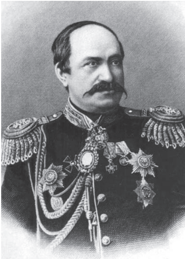
Embajador del Imperio ruso en Estambul, Nikolay Ignatiyev

de inflexión en la postura de Rusia sobre la «cuestión armenia». En un libro de un autor armenio publicado en 1879, se señala que el Tratado de Paz de Berlín “puso las bases del futuro estado armenio”: “En el Congreso de Berlín fue aprobado un artículo de oro. Ahora tenemos que desarrollarlo y sacar el máximo partido” (2, pp. 59-60). Esta no es la primera vez que Rusia utiliza la «carta de triunfo» armenia contra Imperio Otomano: tras la guerra 1768-1774 años, la monarquía rusa comenzó a proporcionar armenios en la porta otomana su «patrocinio», que muy pronto tuvo su manifiesto en la primera rebelión armenia que estalló en Zeytun (Suleymaniye) en el sureste de Asia Menor. Desde entonces, Rusia había tramado planes para establecer el control sobre el Mar Mediterráneo y bloquear el camino de los británicos hacia la India, y al mismo tiempo, a la posesión de los ricos yacimientos de petróleo en el Medio Oriente.