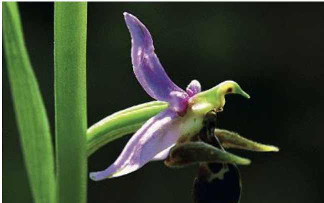
Табиғи ортадағы Хары-бұлбұл гүлі

Шуша Әзербайжандікі. Әзербайжанның мәдени астанасы. Қарабақ хандығының қамалы ретінде негізі қаланған. Өзгеше сипаттасақ қамал ішіндегі қала. XVIII ғасырдың ортасында Панах ханның тұсында салынған. Сондықтан да алғашқы атауы – Панахабад деп аталған. 1773-1853 жылдар аралығында өмір сүрген әзербайжан тарихшысы Мырза Жамал Қарабақлының еңбектерінде: «Панах хан қамал-қала салғанға дейін бұл жерде ешқандай тұрғын-жай болмаған. Сол маңайға жақын елдімекендер тұрғындарына тиесілі жайылым