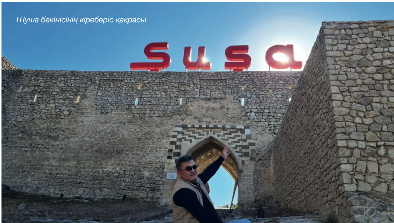
Шуша бекінісінің кіреберіс қақрасы

жеңімпаз халық бөріктерін аспанға атып, тойлап жатқан шақта, ұлы тойға, жеңіс тойына бардық. Баку, Гәнжә, Бәрдә, Шамахи, Газах секілді қалаларды араладық. Соғысты көрмесек те, соғыстың сұрапыл іздерін көрдік.