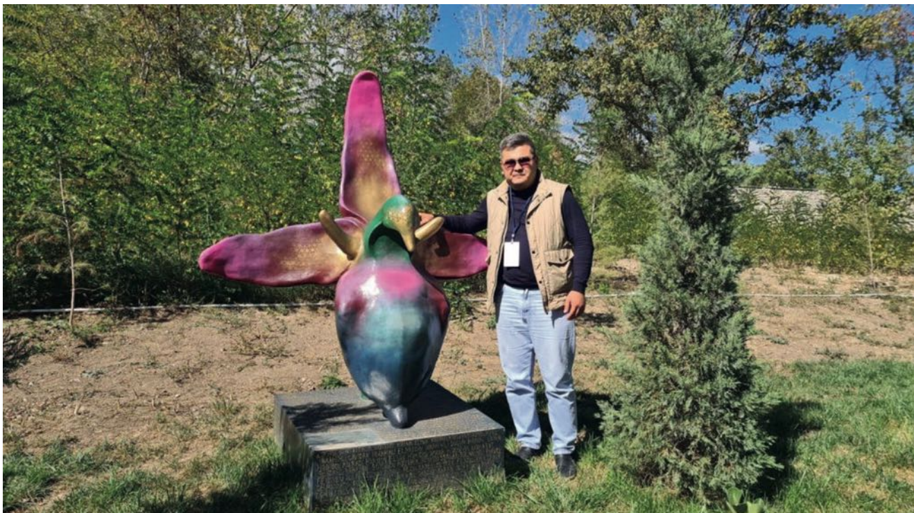
Хары-бұлбұл: Суреткерлердің көзімен

Әзербайжанда, онда да Шушада «Khari-bulbul» деген гүл өседі. Қазақшаласақ «бұлбұл гүлі» дегенге келетін сияқты. Бұл гүл – Әзербайжан әдебиеті мен мәдениетінің алтын бесігі болған Шушаның символы. Өйткені сол аймақта ғана өсетін өсімдік түрі дейді. Енді міне, неше жүз сарбаз шейіт кеткен Қарабақ соғысының, Әзербайжан жеңісінің символына айналды.