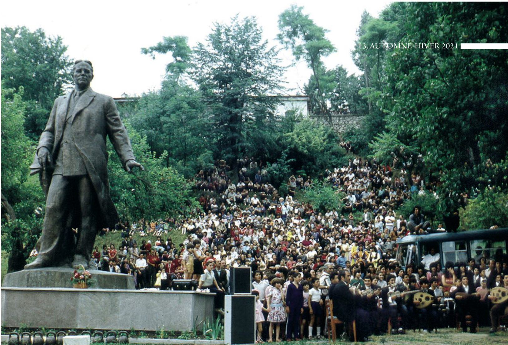
Le festival international de musique « Khari-Bulbul » se tenait chaque année à Choucha, avant l'occupation de la ville par les troupes arméniennes...

ce qui concerne ses propriétés curatives, Navvab est le digne successeur des enseignements d'Ibn Sina) y sont illuminés. Par exemple, à l'image des Frères de la Pureté (scientifiques des Xe et XIe siècles) qui parlaient de la perception individuelle de la musique par différents peuples, Navvab s'attarde sur ce trait caractéristique, citant les mugham contemporains correspondants pour plus de clarté et reliant l'origine de certains d'entre eux avec des phénomènes naturels. Ainsi, la mère de tous les mugham, Rast , rappelle la douce fraîcheur de la brise printanière, tandis que Tchargah est comme le grondement d'un orage. À cet égard, il examine l'un des principaux problèmes de l'interprétation de ce mugham, le lien entre la musique et le texte poétique, en soulignant l'importance de bien choisir les versets appropriés. Les pages du traité consacrées aux règles de la perception musicale sont d'un intérêt inestimable. Se référant à Aristote, Navvab exprime un certain nombre de considérations concernant les règles d'exécution et les conditions de perception de la musique. Il attachait une grande importance à l'emplacement de l'interprète et de l'auditeur, à l'apparence de l'interprète-khanendé, ainsi qu'à l'environnement acoustique. Cette