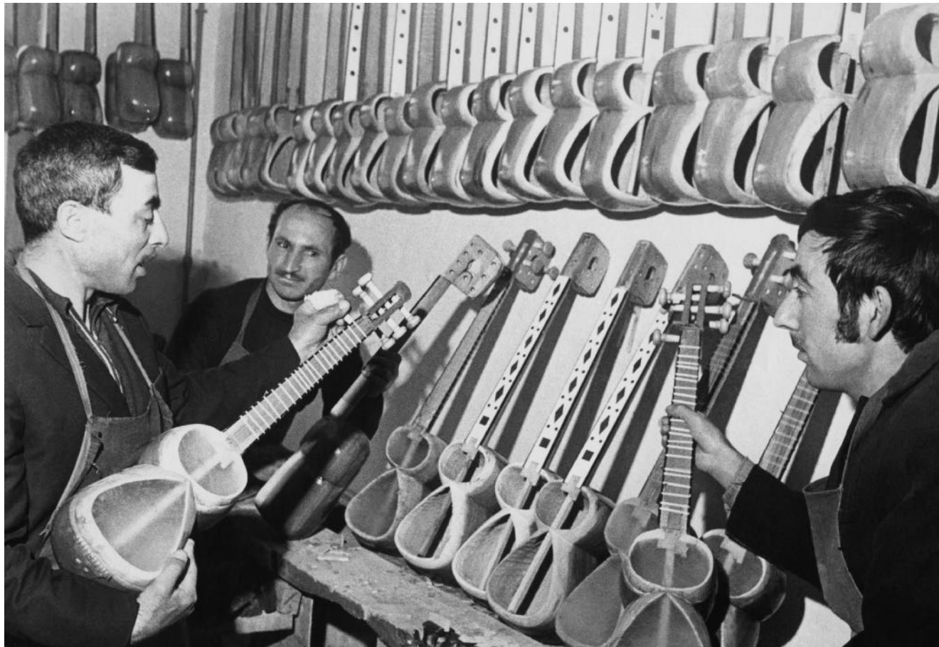
Fabrique d'instruments de musique traditionnels (Choucha, 1968)