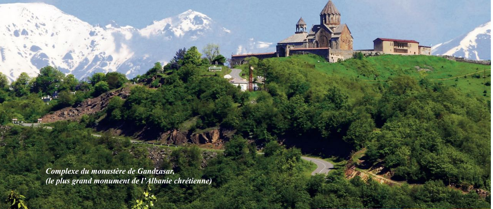
Complexe du monastère de Gandzasar, (le plus grand monument de l'Albanie chrétienne)

utilisée la plus répandue, cependant, le nom original est Aran (ar-Ran, Ran) (2).