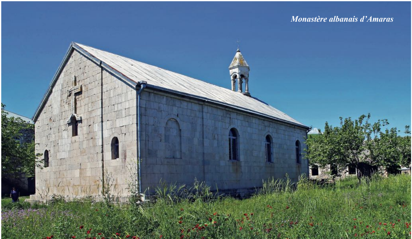
Monastère albanais d'Amaras

richesse et la force de la principauté de Khatchen et l'espoir que la population chrétienne d'Albanie avait pour l'unification des différentes entités et la renaissance de l'État albanais (8). Notons surtout que le souverain de Khatchen se faisait appeler Atabek , témoignant de l'empreinte turque et de son influence sur cette principauté semi-indépendante.