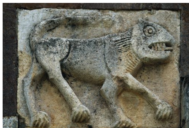
Fragment de décor du monastère de Gandzasar

Les complexes monastiques sont la base même de cette architecture religieuse. Beaucoup d'entre eux sont construits à l'image des tombeaux ancestraux de grandes familles féodales. Les temples (encore aujourd'hui debout) en forme de dôme ont, pour la plupart, été construits au XIIIe siècle et font partie des complexes monastiques du patriarcat de Gandzasar. L'aspect majestueux du temple de Gandzasar reflète la