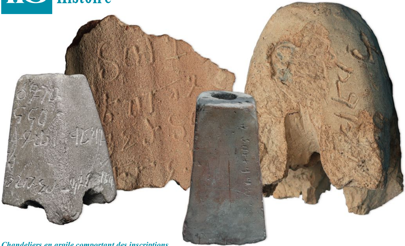
Chandeliers en argile comportant des inscriptions albanaises (Musée national d'histoire de l'Azerbaïdjan)