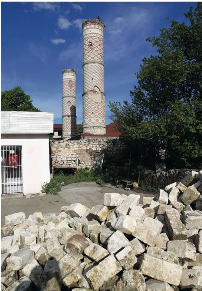
Madrasa près de la mosquée Govkhar Agha à Choucha (XIX e siècle). Elle fut détruite lors de l'occupation arménienne

Pendant la période de l'occupation, les Arméniens détruisaient systématiquement les objets anciens de la civilisation islamique ayant un long passé historique au Karabakh. Près de 70 mosquées, à Choucha, Aghdam, Gubadly, Zanguilan et en d'autres lieux, ont été victimes de l'occupation arménienne, et seules quelques-unes