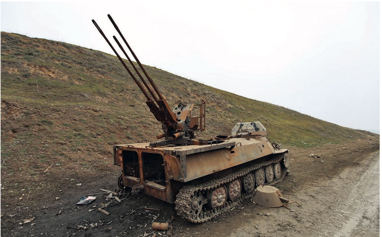
Arma antiaérea autopropelida armênia destruída por um drone do Azerbaijão

Na guerra com a Armênia, o Azerbaijão demonstrou uma tática fundamentalmente nova de guerra em áreas montanhosas e arborizadas que são difíceis de alcançar e intransitáveis, quando as tropas em avanço sempre