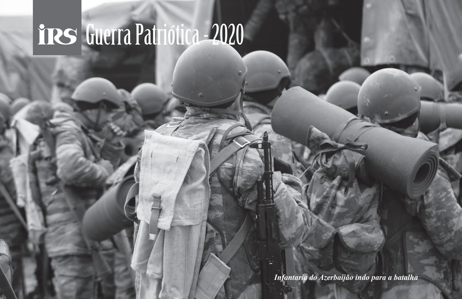
Infantaria do Azerbaijão indo para a batalha

Em primeiro lugar, desde sua proclamação de independência em 1918, a República do Azerbaijão sempre se posicionou como um Estado secular, à frente não apenas da República da Turquia, mas também do resto do mundo muçulmano. Mesmo se um fator religioso realmente desempenhou um papel na vida do Azerbaijão, e dos azerbaijaneses, ao longo do século XX, era um aspecto bastante cultural, não político e, portanto, não poderia influenciar a vida estatal étnica. Por causa disso, a versão moderna do Azerbaijão do Islã secular “não-político” é caracterizada pela lealdade, tolerância e não conflito com outras religiões e culturas, o que a distingue qualitativamente do Islã político do “Magrebe Árabe”.