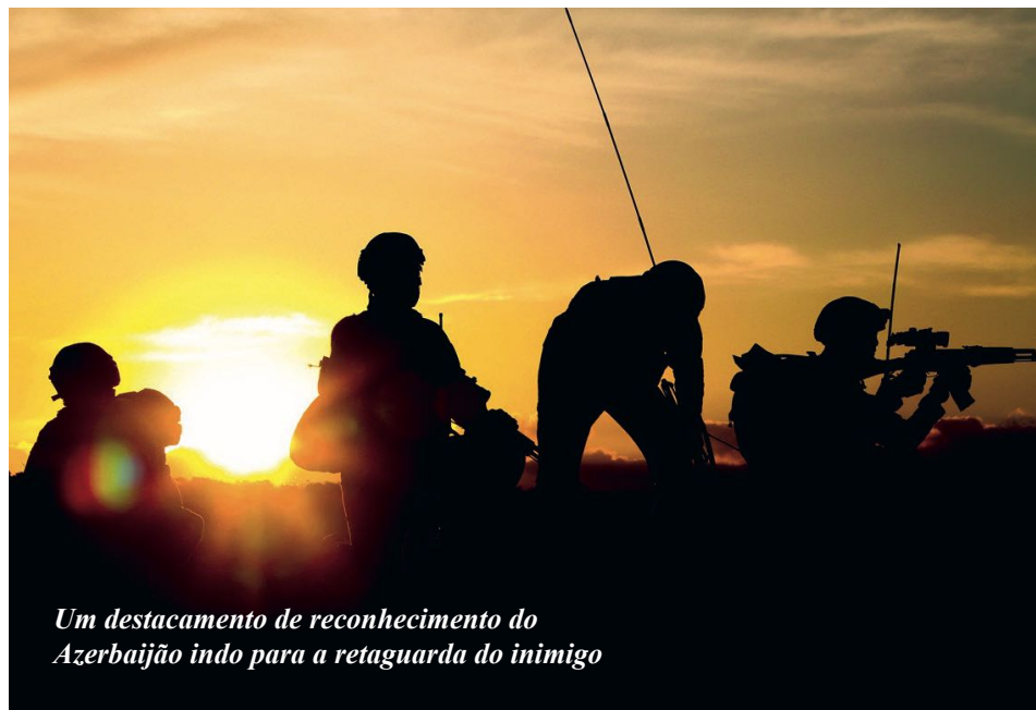
Um destacamento de reconhecimento do Azerbaijão indo para a retaguarda do inimigo

para um filme de ação legal como o americano “Rambo” ou o russo “Pedra”). Ao longo da guerra, não houve um único caso de inobservância de uma ordem nas fileiras do exército do Azerbaijão, mesmo que exigisse auto-