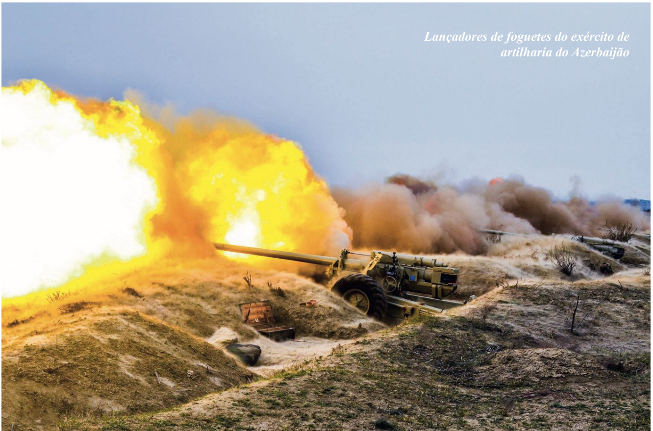
Lançadores de foguetes do exército de artilharia do Azerbaijão

permitiu a obstinação durante a execução de missões de combate. Todos conheciam exatamente suas manobras sob as novas táticas de guerra.