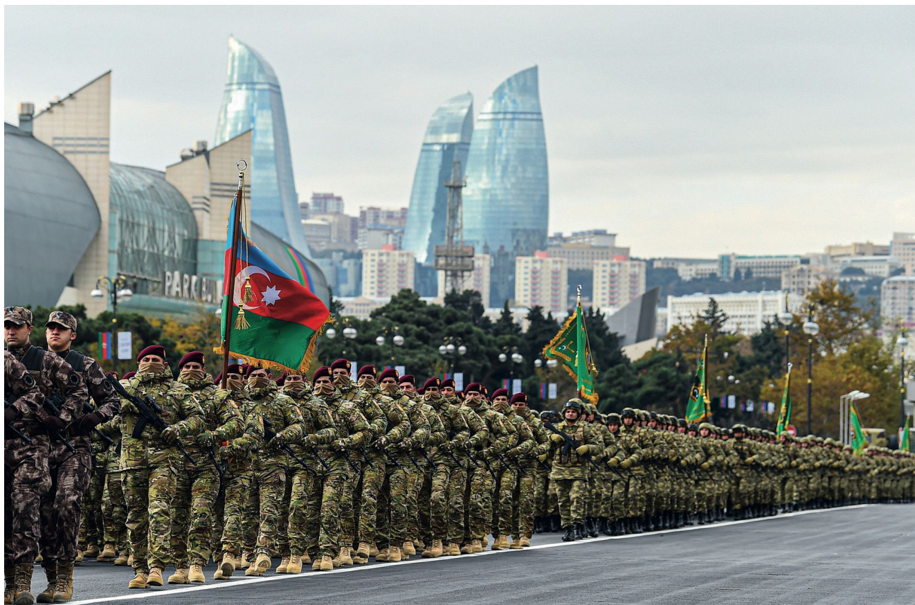
A elite do exército do Azerbaijão, forças especiais, no desfile da Vitória. Baku, 10 de dezembro de 2020

Em 2013, o governo do Azerbaijão anunciou oficialmente a implementação de um plano de dez anos para a modernização total das forças armadas, cujo objetivo era prepará-las para a guerra de libertação de Karabakh, a tarefa geoestratégica mais importante e prioritária do estado do Azerbaijão e sua obrigação política mais importante para com seu próprio povo. O iniciador deste plano foi o Presidente do Azerbaijão, Ilham Aliyev, que também mobilizou todos os recursos do estado para sua implementação rápida e abrangente. Muitas vezes se pode ouvir a frase que os políticos sempre roubam vitórias dos comandantes, mas no caso do Azerbaijão não é o caso. Foi o presidente Aliyev quem criou os recursos e os pré-requisitos ideológicos para a vitória nesta guerra. As forças armadas que estiveram sob seu patrocínio direto por muitos anos só tiveram que vencer a batalha, que aconteceu em outono de 2020. Portanto, ele tem todo o direito de experimentar uma “euforia pós-Karabakh”, como escrevem os malfeitores do Azerbaijão hoje, porque nenhuma outra pessoa neste país fez tanto quanto ele para alcançar a vitória. Sete anos de trabalho contínuo para alcançar a meta da vitória na guerra (é claro, em um círculo fechado de pessoas