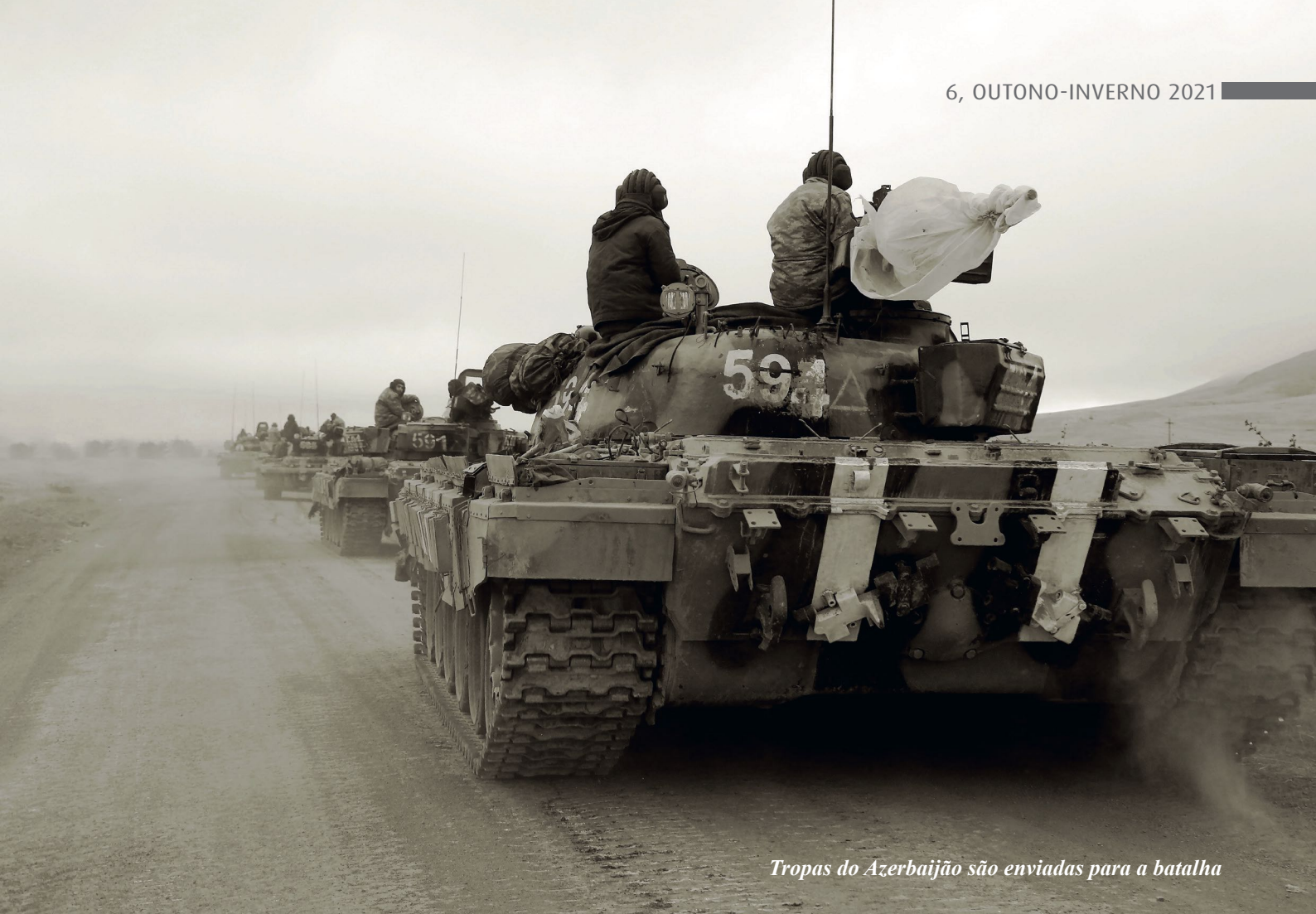
Tropas do Azerbaijão são enviadas para a batalha

ticas por si só não interessa a ninguém, são vistas como uma zona-tampão de “terra arrasada” entre a Rússia e a Europa, são deliberadamente levadas ao caos e à devastação para que a Rússia não possa entrar lá novamente, e mesmo que fizesse, seriam gastos trilhões de dólares e décadas para a revitalização. O Ocidente tem agora a mesma perspectiva para a Geórgia e a Armênia. Pela mesma razão, as autoridades de ocupação armênias, que declararam uma “zona tampão” ao redor de Karabakh, destruíram intencionalmente sua infraestrutura, pois pensavam que vendo esta devastação, os azerbaijaneses nunca se atreveriam a retornar e reviver este deserto feito pelo homem nos territórios ocupados. No entanto, os eventos recentes que se tornaram parte da gloriosa história do Azerbaijão mostraram que eles estavam errados em seus cálculos: o Azerbaijão voltou e irá reviver e restaurar suas terras das cinzas. É precisamente aqui que a superioridade do espírito nacional do Azerbaijão sobre a mentalidade armênic se manifesta hoje.