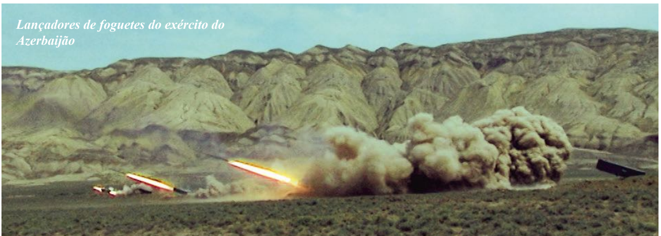
Lançadores de foguetes do exército do Azerbaijão

sistemas de armas, bem como sistemas para combatê-los, o que em grande parte predeterminou sua derrota. A superioridade técnico-militar do Azerbaijão sobre a Armênia deveu-se em grande parte ao fato de que ele tinha a capacidade e o desejo de se armar de várias fontes, fechando contratos de armas com fornecedores da Rússia, Belarus, Israel, França e vários outros países, enquanto os militares armênios tiveram que se contentar com armas predominantemente russas, enquanto muitas armas estrangeiras foram desenvolvidas desde