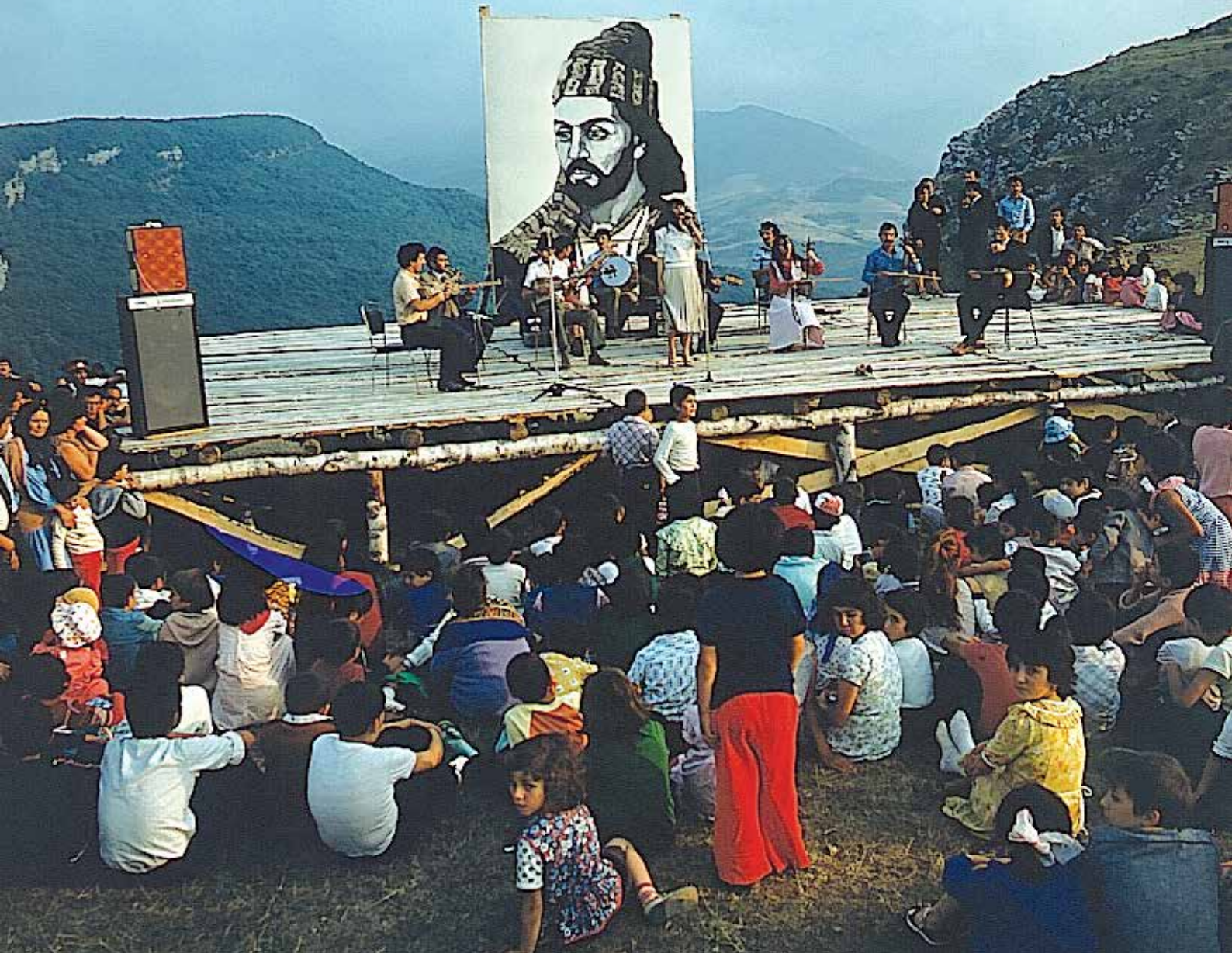
የካራባህ ታዋቂ ገጣሚ ሻጊፍ መታሰቢያ ፊልሞች ሹሻ ውስጥ ይህ ፊልሞች ካራባህ በአርሜንያ የታጠቁ ሀይሎች ከመያዝ በፊት በመደበኛነት ይክበር ነበር

አዲስ ቅርጽ ያለው የምሥራቅ ኮንሰርት ዝግጅት ለመጀመሪያ ጊዜ በ1901 በሹሻ ተከናውኗል።