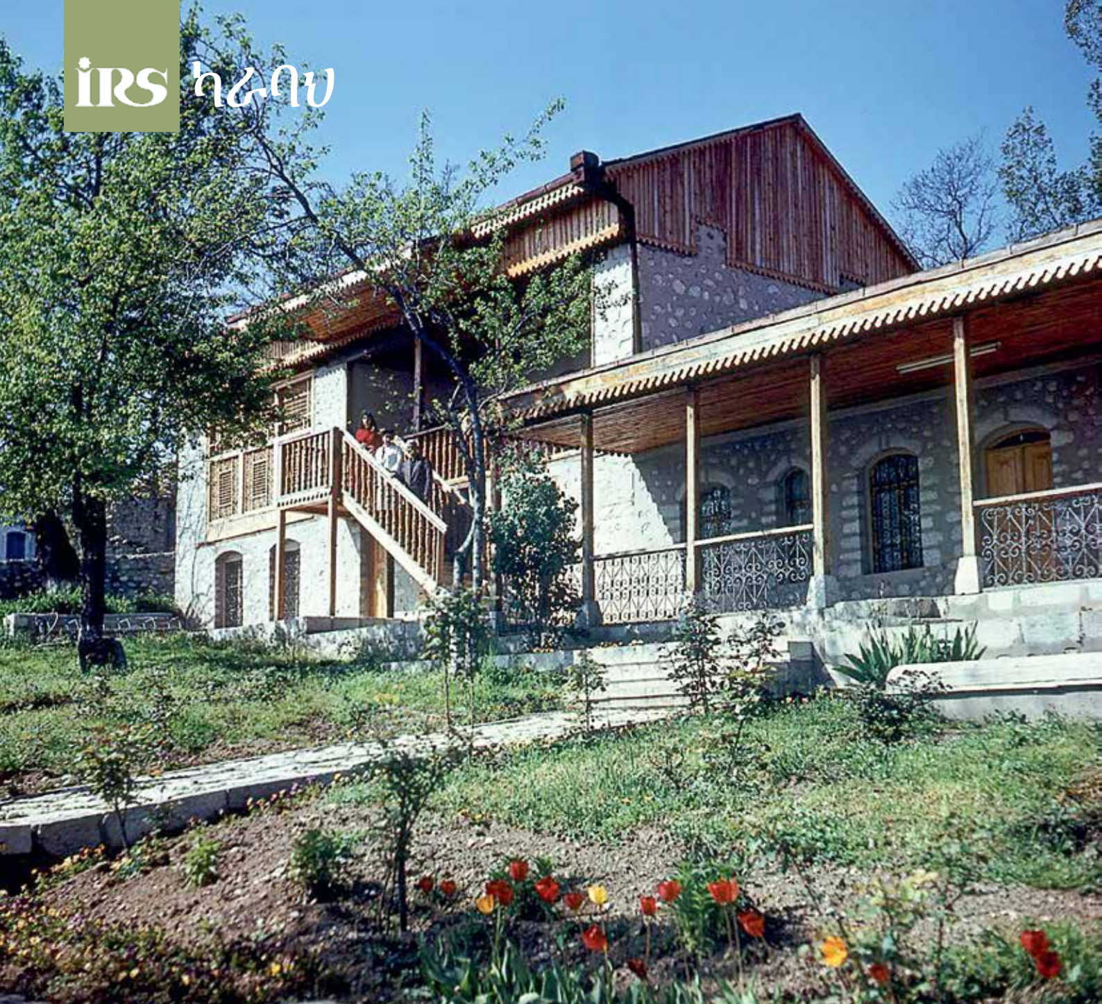
ሹሻ ውስጥ የታዋቂው ዞህራቤኮቭ ቤተሰብ ቤት ፎቶ 1980

ቀን ቆሟል። የጥቃቱ ሰለባ የሆኑ 104 ታርታኖች ቤታቸው ተቃጥሎባቸዋል። 31 ሰዎች ተገድለዋል ከሞላ ጎደል ተመሳሳይ ቁጥር ያላቸው ሰዎች ቆሰለዋል...። አርሚኒያዎች በቂ ዝግጅት ያደረጉበትና የተደራጀ ጥቃት ነበር የፈጸሙት፡- የራሳቸው መሪዎች ቃጂዎችና ነርሶች የሚገኙበት ልዩ ድጋፍ ሰጪ ኃይሎች ነበራቸው...” ይላል። የ1905ን ሁነት በመጥቀስ የቀረበው የያሊዛቤትፖል ገዥ ሪፖርት እንዲህ ይነበባል፡- “በአገሪት በመላው የያሊዛትፖል ክፍለ ሃገር በተለይም በሹሻ ከተማ በአራቱም የደቡብ ወረዳዎች ትልቅ ጉዳት ያስከተለ አድማ ተካሂዷል። በእነዚህ ግጭቶች ጊዜ ወደ 200 የሚጠጉ