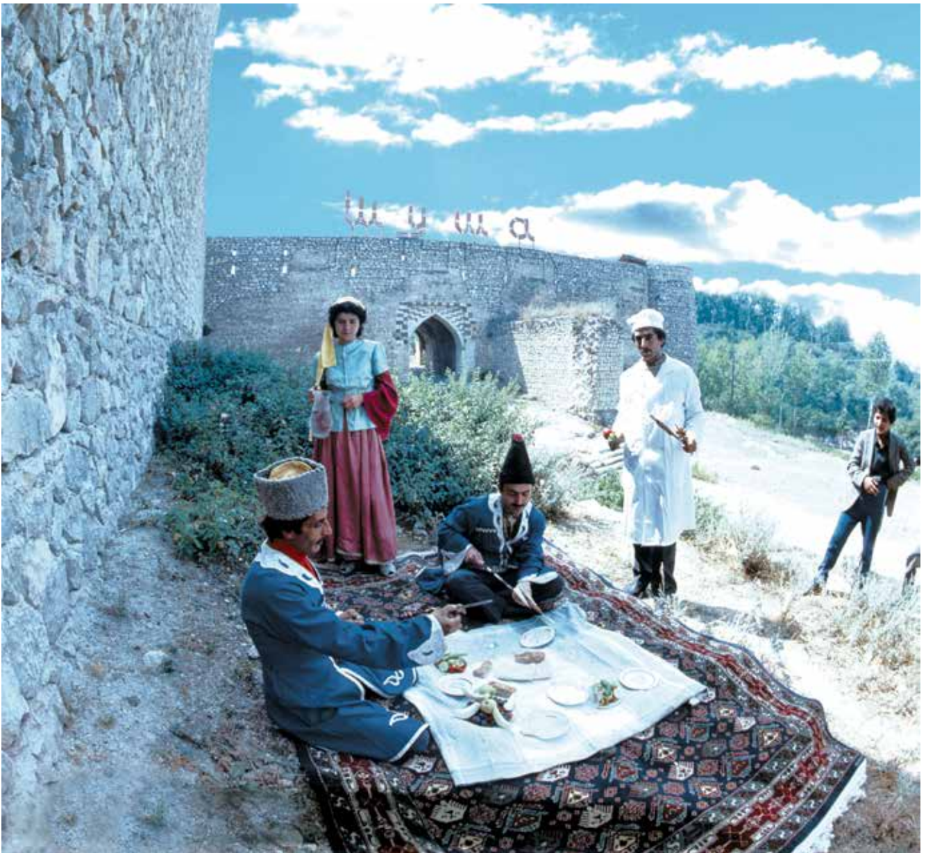
የሹሻ ከተማ ግድግዳዎች እና መግቢያ በ1977ው ክፍለ ዘመን ፎቶ 1980

ጭምር በኢኮኖሚና በባህል ማዕከልነት የምትጫወተውን ጉልህ ሚና ቀጠለች። ሹሻ በ1977 የኪነ ሕንጻ ጥብቅ ቅርስ ማዕከልነት ይዞታ አገኘች። የሹሻ ሕዝብ ልዩ ባህርይ ያለው የድንቅ ልሂቅ ባህል እሴት ባለቤት ነው። ይህች ልዩ ከተማ ከተቆረቆረችበት ጊዜ ጀምሮ ጠንካራ መሠረት የጣለውም ይሄው ነበር። ይህ የሕዝቡ ልዩ ባህርይ አንዳንድ ጊዜ ትምክህት ተደርጎ ሊታይ ይችላል፤ ሆኖም በእርግጥም የሹሻ ነዋሪ የኩራት ምንጭ ብቻ ነው።።