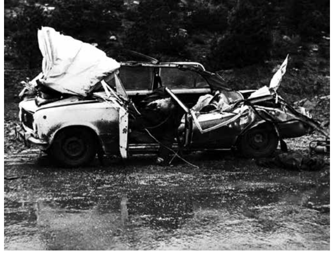
Sovyet Ordusu, topraklarının yitirilmesini protesto eden Azerbaycanlılara tanklarla saldırdı. 20 Ocak 1990, Bakü