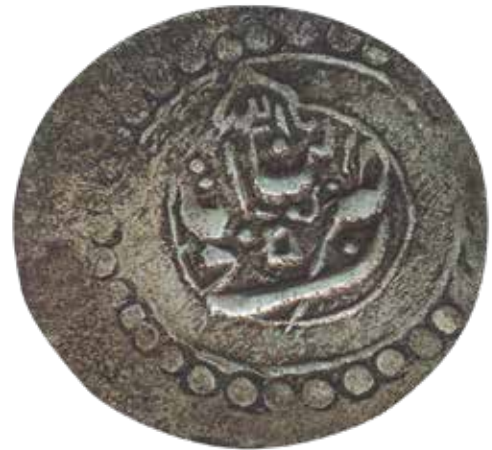
Münze des Karabachs Khanats

Das Reich der aserbaidshanischen Kadscharen umfasste zu Beginn des 19. Jahrhunderts das ganze Territorium des heutigen Irans sowie die Territorien der heutigen Republiken Aserbaidshan, Armenien und Georgien. Georgien erklärte sich 1801 unabhängig von den Kadscharen und schloss sich freiwillig dem Russischen Reich an. Obwohl manche das als eine Annektierung seitens des russischen Zaren Alexander I. sehen. Die Grundlage dafür bereitete noch die russische Zarin Katharina II., die 1783 mit dem georgischen Fürstentum Kartli-Kacheti einen Vertrag über Zusammenarbeit, Unterstützung und Militärhilfe am Ort Georgijewsk im Nokaukasus abgeschlossen hatte. Der Georgijewsker Vertrag wurde zu einer der wichtigen Begründungen für die Eroberung des gesamten Kaukasus – seine nördlichen und südlichen Teile – durch das Russische Reich. Die russischen Zaren galten als Oberhäupter und Hüter der Orthodoxie, das half ihnen unter dem Motto „Die