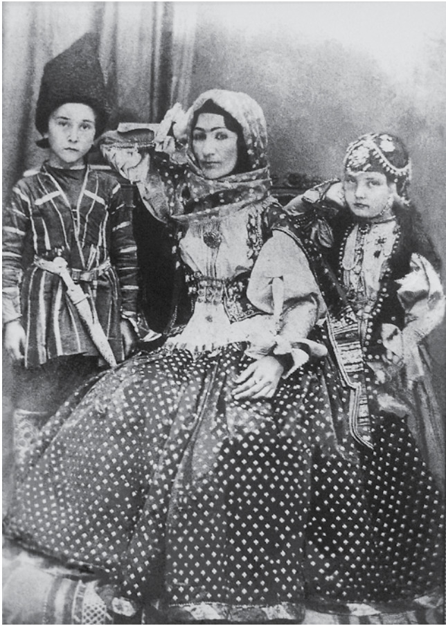
Die Tochter des letzten Herrschers Karabakhs Mehtigulu Khan, die Dichterin Khurschidbanu Natawan mit ihrem Sohn und ihrer Tochter. Zweite Hälfte des 19. Jh.