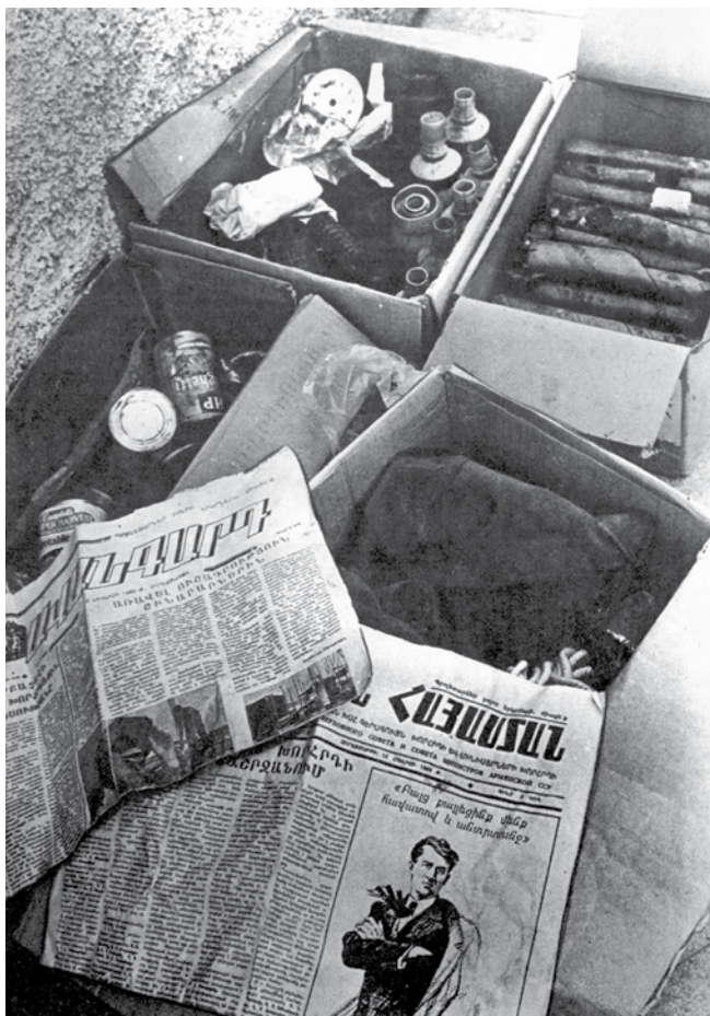
Armenia secara ilegal mengirim buku-buku sovinis, senjata dan bahan peledak ke Garabagh

“pemanasan” Khrushchev yang cukup singkat yang mengakibatkan melemahnya titik tertentu pada rezim politik di URSS, dan menciptakan kemungkinan tertentu untuk dilancarkan aktivitas organisasi-organisasi nasionalis bangsa Armenia. Akan tetapi peranan kunci dalam pengaktifan mereka di mainkan, tidak diragukan lagi, oleh pimpinan Sovyet sebagai bagian dari rencana jangka panjangnya. Hal itu dikarenakan kalangan tertentu yang di pimpinan Kremlin sangat tertarik pada tindakan diaspora bangsa Armenia di seluruh dunia sebagai “kolone kelima” rezim Sovyet. Sebagai bentuk apresiasi terhadap apa yang sudah dilakukan oleh bangsa Armenia maka pimpinan Sovyet bersedia membuat konsesi khusus bagi mereka di URSS. Langkah pertama dalam hal ini adalah diterimanya oleh pemerintah Sovyet pada Agustus tahun 1961 keputusan tentang penyelenggaraan yang disebut dengan “repatriasi” orang-orang Armenia asing ke Uni Sovyet [1, hal.417]. Kemudian pimpinan Sovyet menyetujui legalisasi faktual dari “genosida kaum Armenia” yang dikarang (baca=sejarah palsu) oleh bangsa Armenia sendiri . Pada tahun 60-an abad XX tepatnya pada tahun 1965, untuk di tingkat negara, bangsa Armenia diberikan kebebasan penuh untuk mempromosikan dan menyebarkan delusi “genosida kaum Armenia” dan dengan meriah mereka dapat memperingati hari ulang tahun ke-50 peristiwa