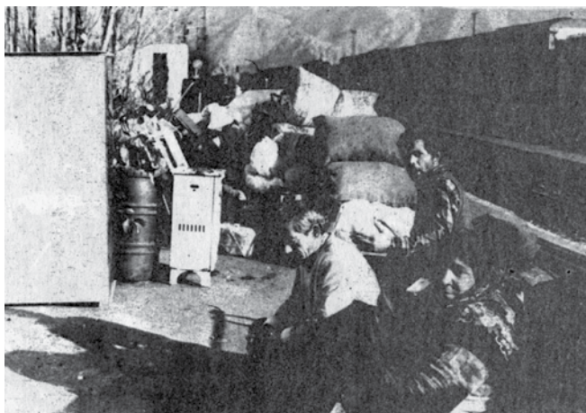
Pimpinan URSS melarang bahkan menyebutkan bahwa lebih dari 200 ribu orang Azerbaijan terusir dari Armenia dan kehilangan seluruh harta milik mereka

dan Nakhcivan dengan Armenia) seperti Silva Kaputikyan dan Zori Balayan. Opus-opus yang disebut para penyelidik ini “membuktikan” bahwa Garabagh dan Nakhcivan adalah milik Armenia. Fabrikasi (baca=serangkaian pergerakan yang dilakukan opus-opus) ini menembus publikasi-publikasi akademis di mana Garabagh dan Nakhcivan tanpa dasar yang kuat dinyatakan sebagai “bagian dari Armenia bersejarah” [1]. URSS sendiri melakukan berbagai tindakan percobaan untuk memberantas para wakil golongan inteligensia Azerbaijan yang berusaha untuk menelanjangi fabrikasi “para penyelidik” Armenia. Ini adalah contoh yang paling nyata untuk “standar ganda” pimpinan Sovyet terhadap bangsa-bangsa Kaukasia Selatan.