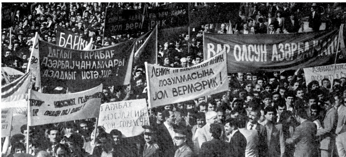
Dalam rapat-rapat besar, orang-orang Azerbaijan memprotes serangan terhadap Garabagh. Tulisan di poster-poster membuktikan bahwa pada waktu itu penduduk Azerbaijan masih percaya bahwa pemimpin URSS dapat menyelesaikan masalah ini

“pemanasan” Khrushchev yang cukup singkat yang mengakibatkan melemahnya titik tertentu pada rezim politik di URSS, dan menciptakan kemungkinan tertentu untuk dilancarkan aktivitas organisasi-organisasi nasionalis bangsa Armenia. Akan tetapi peranan kunci dalam pengaktifan mereka di mainkan, tidak diragukan lagi, oleh pimpinan Sovyet sebagai bagian dari rencana jangka panjangnya. Hal itu dikarenakan kalangan tertentu yang di pimpinan Kremlin sangat tertarik pada tindakan diaspora bangsa Armenia di seluruh dunia sebagai “kolone kelima” rezim Sovyet. Sebagai bentuk apresiasi terhadap apa yang sudah dilakukan oleh bangsa Armenia maka pimpinan Sovyet bersedia membuat konsesi khusus bagi mereka di URSS. Langkah pertama dalam hal ini adalah diterimanya oleh pemerintah Sovyet pada Agustus tahun 1961 keputusan tentang penyelenggaraan yang disebut dengan “repatriasi” orang-orang Armenia asing ke Uni Sovyet [1, hal.417]. Kemudian pimpinan Sovyet menyetujui legalisasi faktual dari “genosida kaum Armenia” yang dikarang (baca=sejarah palsu) oleh bangsa Armenia sendiri . Pada tahun 60-an abad XX tepatnya pada tahun 1965, untuk di tingkat negara, bangsa Armenia diberikan kebebasan penuh untuk mempromosikan dan menyebarkan delusi “genosida kaum Armenia” dan dengan meriah mereka dapat memperingati hari ulang tahun ke-50 peristiwa