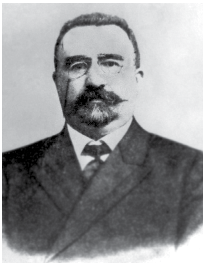
Ketua Parlemen A.M.Topcubasyov. Tahun 1918

1919; Setelah “dilepaskannya” Jepang, Dewan ini kemudian – pada Maret tahun 1919 telah diubah menjadi “Dewan Empat”).