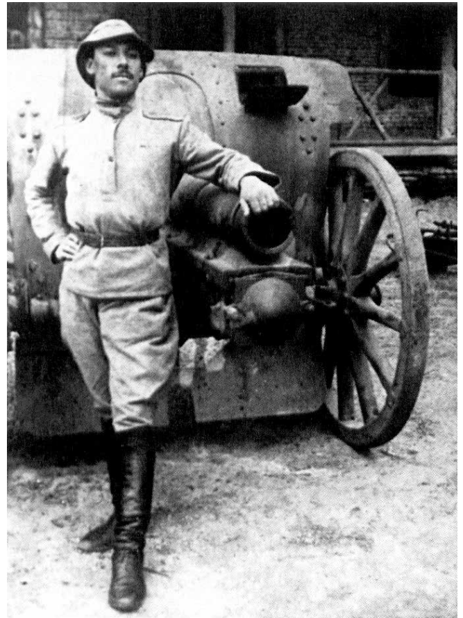
Perwira artileri tentara Azerbaijan. Tahun 1918