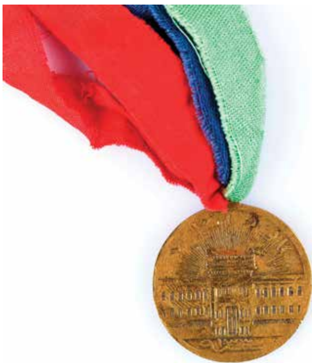
Medali kenang-kenangan untuk menghormati peresmian Parlemen Republik Azerbaijan. Tahun 1918

Pada tanggal 26 Mei tahun 1918 dengan diproklamasikannya kemerdekaan Georgia, Sejm ini berhenti. Pada tanggal 28 Mei tahun 1918, Dewan Nasional Muslimin mengumumkan Azerbaijan sebagai “republik demokrasi merdeka dalam batas Kaukasia Timur dan Selatan”. Diproklamasikannya kemerdekaan Republik Demokrasi Azerbaijan – republik pertama di Timur Muslim merupakan peristiwa luar biasa dalam sejarah kenegaraan Azerbaijan dalam kurun waktu tiga ribu tahun lamanya.