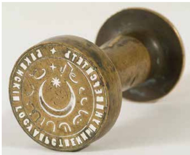
Stempel Universitas Negeri Baku. Tahun 1919