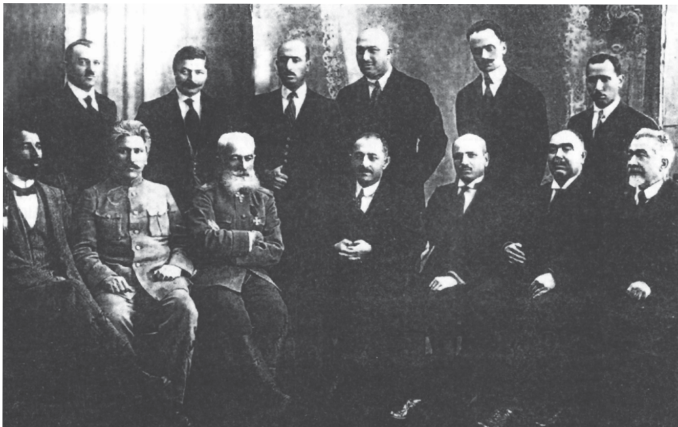
Kabinet Menteri Republik Azerbaijan. Tahun 1919

Pada tahun 1918-1919, negara-negara sekutu utama telah solider dalam perlunya pelemahan sikap geopolitik Rusia Sovyet di sekeliling perbatasannya, karena sikap ini dianggap sebagai sumber bahaya Bolshevik terhadap Barat yang beradab. Tetapi kalangan penguasa Britania Raya pada awal tahun 1919 merasakan bahwa kekuatan mereka untuk menekan kaum Bolshevik sudah sampai pada titik “lelah”. Tibalah saatnya tinjauan akhir dari tahapan kemampuan untuk mendukung kemerdekaan republik-republik Transkaukasia, terutama